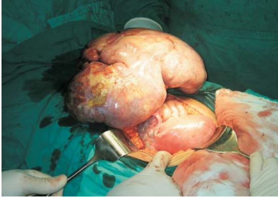
Resim 3: Disgerminom

26 yaşındaki hastamız 34 haftalık iken vaginal preterm doğum yaptı. Lohusalıkta unilateral ooforektomi ve cerrahi evreleme yapıldı. Evre I C tanısı konulan hastaya geçici renal yetmezliği olduğu için radyoterapinin nefrotoksik etkilerinden kaçınmak için over transpozizyonu yapılarak pelvik radyoterapi yapıldı. İnvazif epitelial over tümörlerinde durum farklıdır. Bu tümörlerin gebelikte görülme olasılıkları çok nadir olmakla beraber görüldüklerinde genellikle ileri evre tümörlerdir, özellikle seröz tümörler bilateraldir ve çok çabuk intraperitoneal metastazlar yaparlar. Erken gebelik haftasında olan ileri evre olgularda TAH+BSO+ debulking cerrahi yapmak gerekir. Özellikle çok istenen ve viabilite sınırlarına yakın gebelik haftalarında gebeliğin korunması bakımından konservatif kalmabilir, debulking cerrahi fazla agresif olmamak üzere yapılabilir. Adjuvan tedavi gerekiyorsa kemoterapiye başlanır ve çocuk viabilite sınırlarına gelince sectio yapıp cerrahi tamamlanmalıdır. Bu tedavi yöntemi gebelikte sitostatik tedavinin kullanılabilirliği sorusunu akla getirmektedir. Bizim bir invaziv epitelyal over tümörü olgumuz vardı. 24 yaşındaki hasta, 16 haftalık gebeydi. Torsiyone over tümörü nedeni ile laparotomi yapıldı. Histolojik sonucun 1C müsinoz adeno karsinom gelmesi üzerine 19. gebelik haftasında TAH+BSO ve evreleme cerrahisi yapıldı.