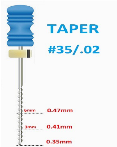
Resim 1. Taper nedir?

Taper, endodontik bir eğenin apikal ucundan koronale doğru gidildikçe her milimetre başına artan çap miktarına denir. Örneğin Resim 1'de gösterilen 0.35 mm çapa ve .02 taper değerine sahip bir eğenin apikalden koronale doğru 3. mm'sinde eğe çapı artarak 0.41 mm olacaktır.