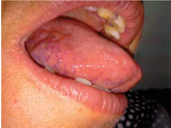
Resim 1. Dil lateralinde morumsu papüller