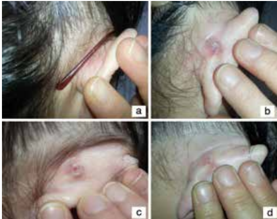
Resim 1a, b, c, d. Kulak arkasında gözlük sapının geldiği alanda ortası fissüre papül, d) Gözlük değişimi sonrası kendiliğinden papülde gerileme