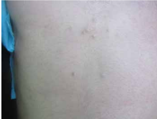
Resim 1. Göğüs ön yüzde deri renginde 1-3 mm çapında 7-8 adet papüller lezyonları mevcut

Yirmi yaşında erkek hasta göğüs ön duvarında 2 yıl önce başlayıp giderek artan çok sayıda kabarıklık şikayeti ile polikliniğimize başvurdu. Öz ve soygeçmişinde herhangi bir özellik yoktu. Dermatolojik muayenesinde göğüs ön yüzde deri renginde 1-3 mm çapında 7-8 adet multipl papülleri mevcuttu (Resim 1). Tanı için alınan biyopsi örneğinin histopatolojik incelemesinde retiküler dermiste düzleşmiş skuamöz epitelyum ile döşeli kist lezyonu izlenmekteydi (Resim 2a). Kist kavitesinde lameller keratinöz materyal ve kıl shaftları mevcuttu (Resim 2b).