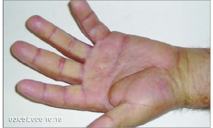
Resim 5. Sol avuç içindeki lezyonun tedavi sonrası görünümü

nükleer atipi ve mitotik aktivite yoktu. İntraselüler ve ekstraselüler PAS pozitif hyalin globüller görüldü (Resim 3). Hastaya plak evre KS tanısı konuldu.