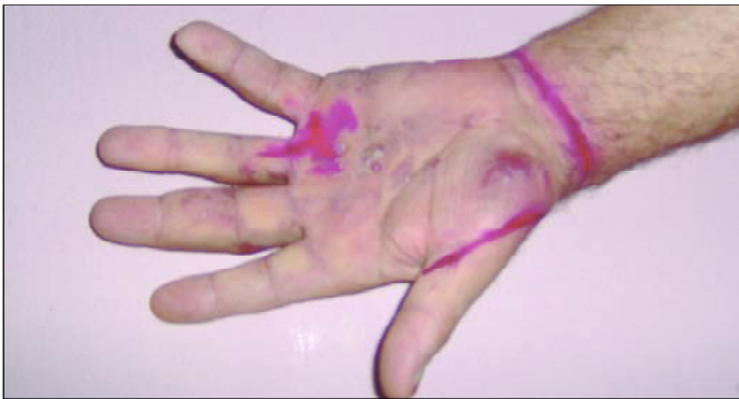
Resim 2. Sol avuç içindeki mor papül ve plakların görünümü