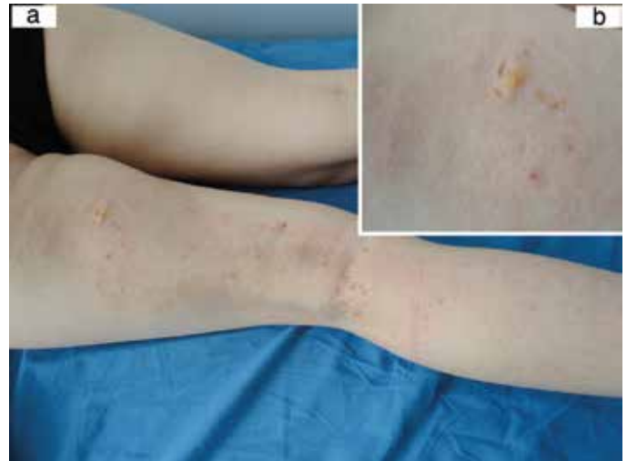
Resim 1. a) Sağ bacak arka yüzünde hafif eritemli, hiperpigmente maküllerin, yer yer atrofik hipopigmente görünen alanların bulunduğu lezyonlar, b) Yumuşak, sarımsı nodülün yakın görüntüsü

Yazışma Adresi/Address for Correspondence: Dr. Müzeyyen Gönül, Ankara Numune Eğitim ve Araştırma Hastanesi, Dermatoloji Kliniği, Ankara, Türkiye Tel.: +90 532 666 72 49 E-posta: muzeyyengonul@gmail.com Geliş Tarihi/Received: 27.02.2013 Kabul Tarihi/Accepted: 11.03.2013