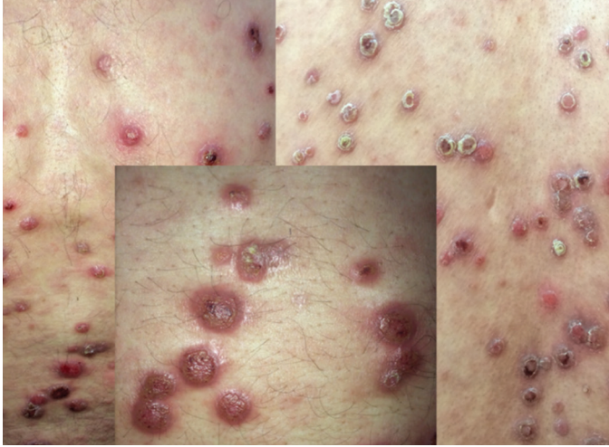
Resim 2. Sifiliz papulosa lenticularis (yanlar), eroziv papüllerde tromboz dilate damarlar (orta)

ipuçlarını okuyabilmek çok önemlidir. Tutulma alanlarına göre papüllerin farklı isimlendirilmesi teşhis için farkındalığı arttırmaktadır. Hasta bilgilendirilmiş onamı alındı.