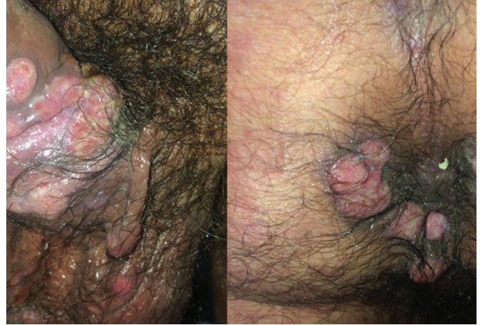
Resim 3. Papule aşındırıcı (condylomata lata)

Cerrahi ve Medikal Uygulama: E.Y.E., G.V., Konsept: Ç.T., H.M.E., Dizayn: Ç.T., H.M.E., Veri Toplama veya İşleme: Ç.T., Analiz veya Yorumlama: Ç.T., H.M.E., Literatür Arama: Ç.T., E.Y.E., G.V., Yazan: Ç.T.