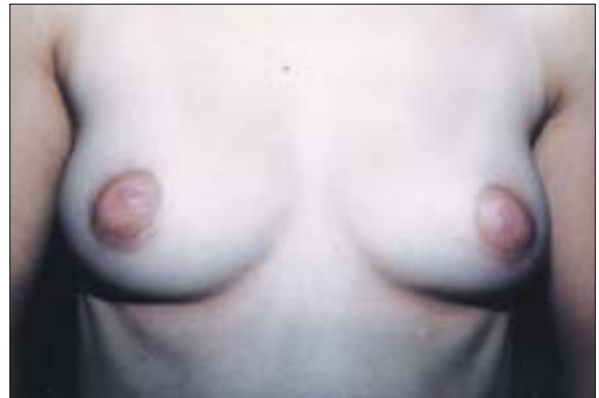
Şekil 5: Tedavi sonrası önden görünüm.