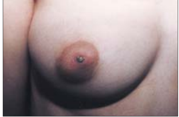
Şekil 3: Nevoid hiperkeratoz sağ meme.