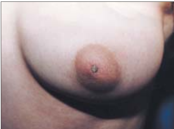
Şekil 2: Nevoid hiperkeratoz sol meme.