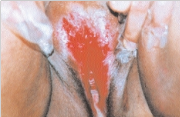
Şekil 2: Bir kadın olguda görülen eroziv paternde vulvar tutulum.

detli eroziv formlara kadar değişmektedir. Genital bölge tutulumu olan olgularda kaşıntı şikayeti sıktır ve kadın hastalarda vulvar bölgede hassasiyet, yanma, şiddetli formlarda disparoni ve vaginal akıntı da görülebilmektedir 2,7 .