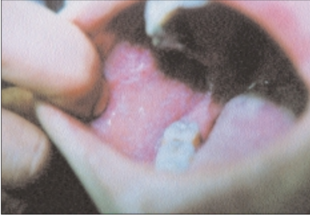
Şekil 1: Oral mukozada retiküler, ağış paternde liken planus lezyonları.

Oral mukoza tutulumu ile ilgili olarak literatürde farklı oranlar bildirilmesine rağmen ortalama %15-35 arasında değişmekte olup bu oran kutanöz tutulumla birlikte olduğunda %50-65'e çıkmaktadır 4,5 . Lezyonlar en sık bukkal mukoza ve jinvivada görülmektedir. En sık retiküler tipte bulunan lezyonlar plak tip, atrofik, eroziv, papüller, büllöz ve ülseratif olarak ortaya çıkabilir 6 . Liken planusta dış genital mukoza tutulumu erkeklerde %25 oranında bildirilmesine rağmen kadınlarda bu oran bilinmemektedir 7 . Erkeklerde genital bölge lezyonları en sık papüller tipte olup penis shaftında, glans penisde ve skrotumda görülmektedir. Kadınlarda ise vulva tutulumu, retiküler papüller lezyonlardan vulvar yapıyı bozabilen şid-