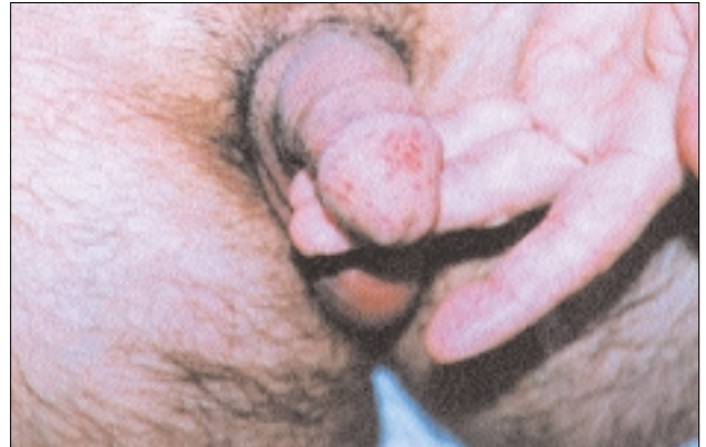
Şekil 3: Peniste klasik liken planus lezyonları.

Literatürde kadın hastalar arasında liken planusun dış genital mukoza tutulumuyla ilgili az sayıda çalışma bulunmaktadır. Ancak bu çalışmalarda kutanöz tutulum dikkate alınmamıştır. Eisen ve ark. 9 399 liken planuslu kadın hastanın %20'sinde vulvar tutulum saptamışlardır. Vulvar tutulumu olan hastaların %25'inde asemptomatik retiküler lezyonlar izlenmiş, %75 hastada ise yanma, ağrı ve vaginal akıntının olduğu eroziv tipte liken planus görülmüştür. Aynı çalışmada 174 liken planuslu erkek hastanın % 4,5'inde genital bölge tutulumu tespit edilmiştir. Erkek hastaların 4'ünde kaşıntı ve 2'sinde yanma şikayeti mevcut olduğu saptanmıştır. Lewis ve ark. 12 37 liken planuslu kadın hastadan oluşan serilerinde 19 (%51) hastada vulval tutulum gözlemişlerdir. Bizim çalışma grubunda vulval tutulum %16 olarak belirlenmiştir. Bu oran Lewis ve ark'nın çalışmasına oranla oldukça düşüktür. Çalışmamıza sadece kutane LP'u olan hastalar alındığı için oranlar arasında fark mevcuttur.