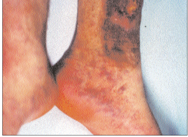
Şekil 2: Olgunun her iki ayak sırtı ve yan kısımlarının görünümü.

proliferasyonu, damar endotellerinde şişkin görünüm, damar duvarlarında kalınlaşma, damarlar etrafında interstisyel alana da yayılan ve yer yer epidermis içine yayılan eozinofil polimorflardan zengin iltihabi hücre in-