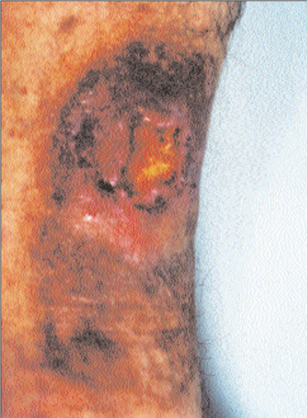
Şekil 1: Sol alt ekstremitede tespit edilen ülsere lezyon.