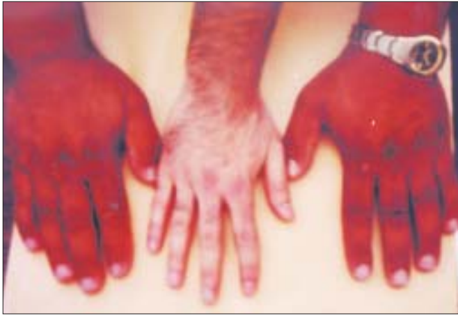
Şekil 1. Her iki el sırtında hiperpigmentasyon

Laugier-Hunziker sendromu selim bir durumdur ve tedavi gerektirmez 6 . Ancak Q-switched Alexandrite lazerle 11 ve Q-switched Nd-Yag lazer 12 ile başarılı sonuçlar bildirilmiştir. Eğitici özelliğinden dolayı sunduğumuz hastamıza herhangi bir tedavi uygulanmadı.