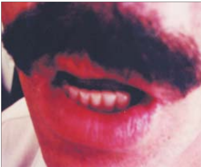
Şekil 2. Alt dudakta hiperpigmentasyon