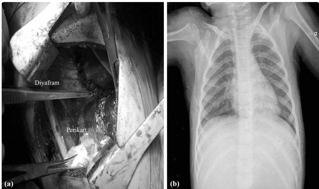
Şekil 2. (a) Diyafragma ve perikardın dikildikten sonraki görünümü, (b) ameliyat sonrası üçüncü ay arka-ön akciğer grafisi.

Diyafram yırtığı gelişen olgular semptomsuz olabileceği gibi karın organların herniasyonu geliştiğinde, solunum veya gastrointestinal kanalın mekanik tıkanıklık semptomları da ortaya çıkabilmektedir. To-