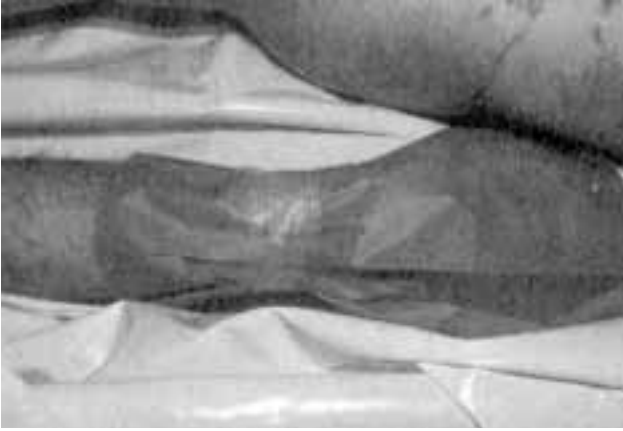
Şekil 2. Adli bir olguda ellerin kağıtla örtülmesi. [12]

hastanın vücudunu ılık suyla sileceğini belirtti (Tablo 2). Ancak hastanın elleri ve vücudu, ilgili uzman kişi gelene kadar silinmemelidir. Çünkü ellerin ve vücudun silinmesi delillerin kaybolmasına neden olacaktır. Şiddet olaylarında barut izi kıyafetlerde ve tırnak aralarında bulunabilmektedir. [1] Hem biyolojik hem de kimyasal delillere zarar verebilmektedir.