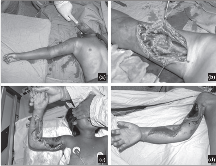
Şekil 3. (a) Isırktan sonra 4. gün görünüm. (b) Dördüncü gün miyonekroz, (c) fasyotomiden 24 saat sonraki görüntü, (d) defektin 15. gün görüntüsü.

Renkli şekiller derginin online sayısında görülebilir. ( www.tjtes.org )