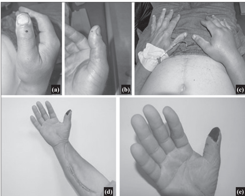
Şekil 4. (a, b) Isırktan 6 saat sonra parmağın venöz kanayan, siyanotik görünümü, (c) 24 saat sonra hızlı gelişen ödemin diğer ekstremitelerle karşılaştırmalı görüntüsü. (d, e) Yirmi bir gün sonra fasyotomi hattı ve parmağın görünümü.

Sağ el 1. parmağı ısırılan 60 yaşında erkek hastaya parmakta total siyanoz, antekubital bölgeye kadar