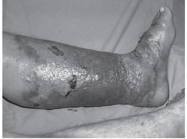
Şekil 1. Isırktan 72 saat sonra kliniğimize sevk edilmiş bir hastada görünüm.

Ülkemizde en sık görülen engerek yılan zehirlenmelerinde ise daha çok lokal ve hematolojik bulgulara rastlanmaktadır. [7] Isırık bölgesinde başlayan ve giderek artan ağrı, ödem, ısı artışı veya ateş, yayılmaya meyilli peteşi ve ekimozlar genel klinik bulgulardır. Yılan ısırıklarında oluşan zehirlenmelerinin tedavisinde acil durumlar dışında genel yaklaşım antiserum tedavisi, tetanoz profilaksisi ve lokal yara bakımındır. [7,8] Yılan ısırıklarının büyük bir çoğunluğu ekstremiteelerde olmakta ve bunların bir kısmında kompartman sendromu gelişmektedir. Literatürde yılan ve böcek