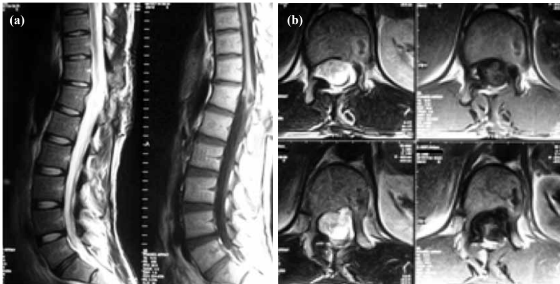
Şekil 2. (a, b) MRG'de T12 korpusu düzeyinde, sol L1 köküne bası yapan, spinal kordu sağa deplase etmiş kitle görülmekte.

Spinal cerrahisi sonrası psödomeningosele insidansı, çoğu olgunun asemptomatik olmasından dolayı bilinmemektedir. [8] Swanson ve Fincher 1700 laminektomi sonrası %0,068, [9] Teplic ve arkadaşları 400 laminektomili hastada %2 oranında psödomeningosele geliştiğini bildirmişlerdir. [2] Semptomlar arasında baş ağrısı, boyun ağrısı, miyelopatik bulgular radiküler bulgular görülebilir. [5-8,10] Bu semptomlar kistin spinal kord, sinir köklerine basısı, kist içerisinde rotların tuzaklanması veya periradiküler fibrozise bağlı olabilir. [8,10] Bizim olgumuzda semptomlar kesenin sol L1 köküne bası ve kese içerisinde sinir köklerinin tuzak-