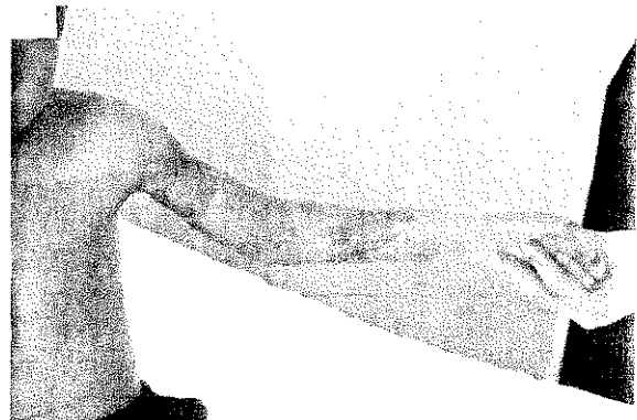
Resim 4: Reimplantasyon yapılan aynı ekstremitenin postoperatif 6. aydaki görünümü.

Üst ekstremitte reimplantasyonunun başarısı ile ilgili çok çeşitli çalışmalar vardır. Genel olarak, reimplant canlılığı %69-90 arasındadır (3,7,12). Çocuklarda bu oran %70'den daha yüksek değildir (1,3,4). Ampute kısmın reimplantasyonundan sonraki başarısızlığın en başta gelen nedeni, ciddi crush yaralanmasıdır. Daha sonra arteriyel