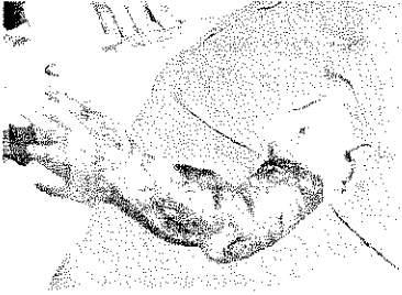
Resim 1: Reimplantasyon yapılan ekstremitenin postoperatif 3. gün görünümü.