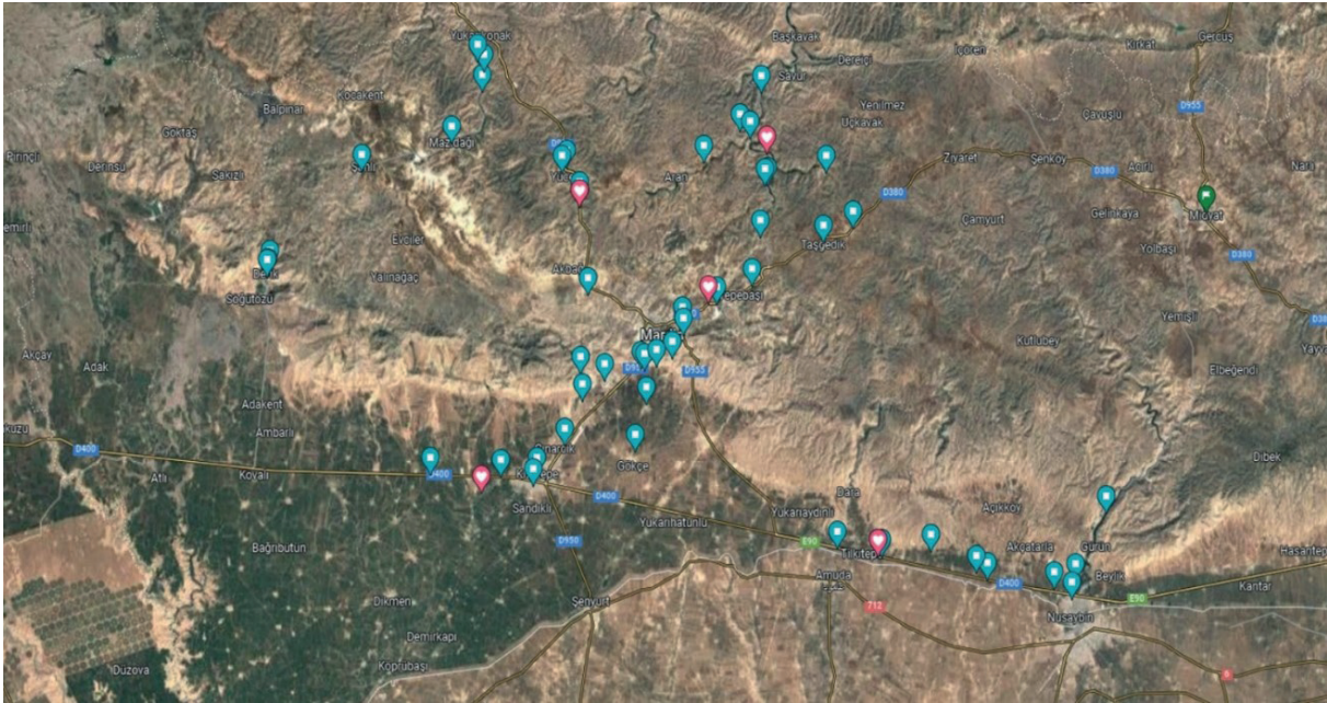
Resim 1. Örnek toplama alanları ve Cryptosporidium spp. saptanan (Kırmızı) ve saptanmayan (Mavi) bölgeler