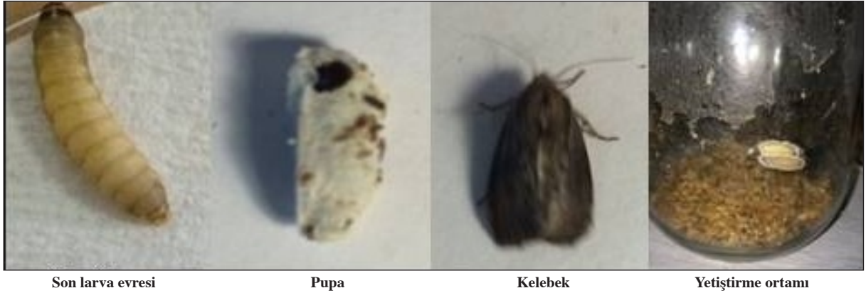
Resim 1. Galleria mellonella gelişim evreleri ve yetiştirme ortamı

Patojenlerin toksinlerine karşı memelilerin ve böceklerin duyarlılığında da paralellikler bildi-