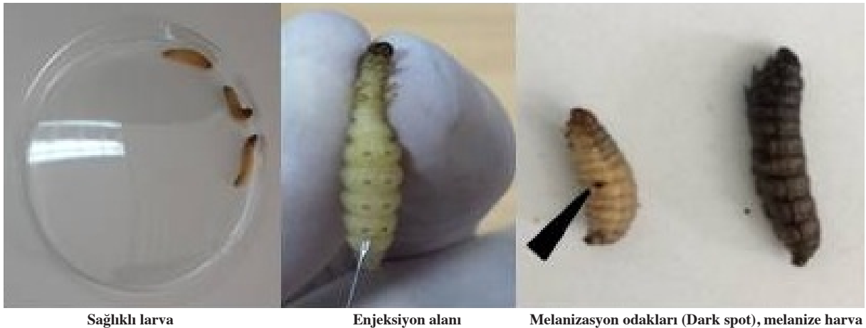
Resim 2. Galleria mellonella larvasında enjeksiyon bölgesi, sağlıklı ve enfekte larva