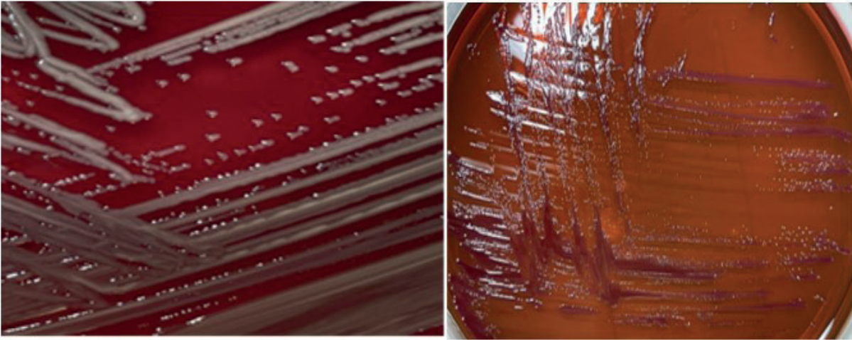
Resim 2. Chryseobacterium indologenes 'in soldan sağa sırayla %5 koyun kanlı agar ve eozin-metilen mavisi (EMB) agar besiyerlerinde oluşturduğu koloni morfolojileri