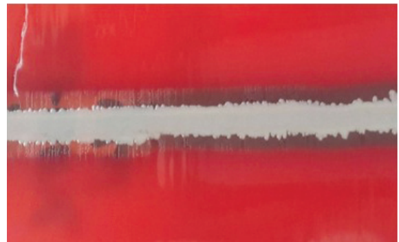
Resim 2. Aggregatibacter aphrophilus süt-anne fenomeni pozitifliği.