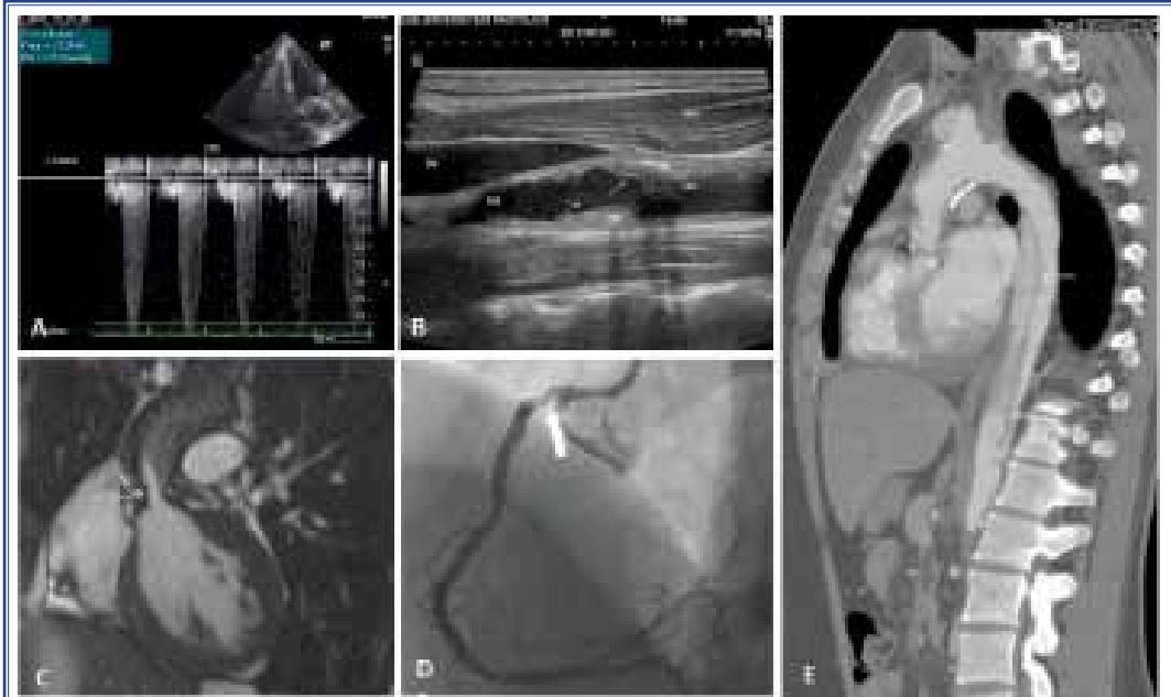
Şekil 2. Homozigot ailevi hiperkolesterolemi olgularında çeşitli görüntüleme yöntemleri ile belirlenen aterosklerotik lipid birikimleri ve klinik sonuçları görülüyor: (A) Doppler ekokardiyografide ciddi aort darlığını gösteren akım trasesi (sistolik aortik gradient 88 mmHg), (B) Karotisin ultrasonografik değerlendirmesinde ana karotis arter (KKA) ve internal karotis arter (IKA) duvarları diffüz kalınlaşmış, lümeni daraltan kalsifik plaklar görülüyor (3 yıldır düzenli aferez tedavisi alan 22 yaşındaki olgu) SKM: Sternoklaidomastoid kas, İJV: İnternal Jugüler Ven. (C) Sol ventrikül çıkış yoluna ait SSFP ("steady-state free precession") sekans görüntüde sistol esnasında aort kapağı düzeyinde stenoza bağlı jet akım (beyaz ok) ve aort kapak yaprakçıklarında kalınlaşma izlenmekte, (D) Koroner anjiyogramda sağ koroner arter ostiumunda orta derece darlık yaratan plak (3 yıldır düzenli afereze giren 28 yaşındaki olgu), (E) Manyetik rezonans görüntülemede desendan torasik aorta seviyesinde, sol ana pulmoner arter düzeyinden başlayan ve superior mezenterik arter orifisi seviyesine dek devam eden diseksiyon flebi ve asendan aortadan itibaren duvar çeperinde yaygın lipid birikimleri izleniyor.

İzlemede, aferez vb tedavilerle etkin LDL-K düşüşü sağlansa bile hem afereze hem de hastalığın do-