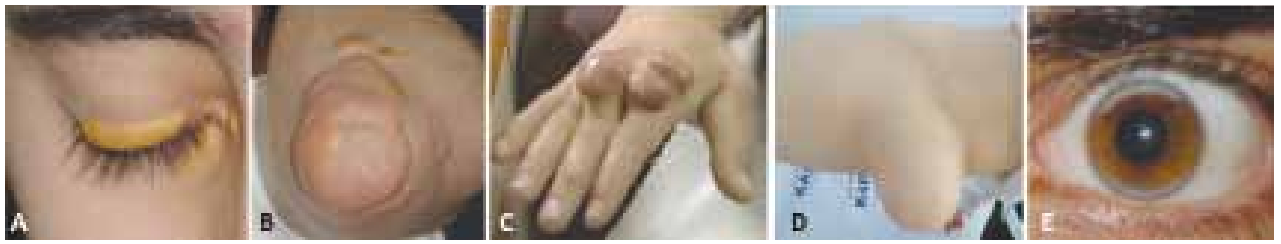
Şekil 1. Homozigot ailevi hiperkolesterolemi olgularında kolesterol birikimlerinden örnekler görülüyor. (A) Göz kapaklarında tipik ksantelezma (18 yaşında olgu), (B) Dirseklerde ekstansör yüzde kolesterol birikimi, (C) El sırtında ve parmaklarda ekstansör tendonlarda ksantomlar ve el sırtında deride yoğun kolesterol birikimi, (D) Dirsek ekstansör yüzde dev ksantom, (E) Korneada Arkus lipemia (2 yıldır lipit afrezi tedavisi gören 19 yaşındaki olgu).

tan sonra uzman lipit merkezine yönlendirilme süresi de ortalama 5 yıldır. [16] Onyeddi olguluk bu seride 1. veya 2. dekatta gelişen tipik deri bulguları nedeniyle hastaların hepsinde ilk başvuru birinci basamak hekimleri ve dermatologlara olmuş ve yoğun aile öykülerine rağmen hiperkolesteroleminin akla gelmediği görülmüştür. Tanının bu denli gecikmesinde esas neden, birinci basamak hekimlerinin AH konusunda farkındalık düzeyinin yetersizliğidir. [16]