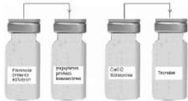
fişkil 1. Fibrin doku yapıştırıcısının hazırlanması

Ameliyatta kullanılan fibrin doku yapıştırıcısı (Tisseel, Two-Component Fibrin Sealant Vapor Heated, Baxter Healthcare Corporation Glendale, CA, USA) sağlığı kiffilerin kan plazmasından elde edilmektedir. Bu üründe, 4 adet flakon bulunmaktadır (fişkil 1). Birinci flakonda aprotinin içeren Fibrinoliz önleyici solüsyon bulunur. Bu solüsyon sığırdan (bovin kaynaklı) elde edilir. İkinci flakonda insan kaynaklı fibrinojen, polysorbate, sodium chloride, trisodium citrate, glycine bulunur ve yapıştırıcı protein konsantresi adını taşır. Birinci flakondaki Yapıştırıcı protein konsantresi ikinci flakondaki fibrinoliz önleyici solüsyon içinde çözünür. Üçüncü flakonda kalsiyum klorür solüsyonu, dördüncü flakonda ise insan kaynaklı trombin bulunmaktadır. Trombin de kalsiyum klorür solüsyonu içerisinde çözünür. Böylece elde edilen iki karışım ayrı enjektörlere çekilmekte ve enjektörlerin ortak olan pistonu ile aynı anda ve aynı miktarlarda uygulama sahasına enjekte edilmektedir (fişkil 2). Uygulandığı alanda birleşen bu maddeler kalın bir zar gibi yüzeysel tabaka oluştururlar. Bu süreçte önce trombin fibrinojeni etkileyerek stabil olmayan fibrin yumagının oluşmasına neden olur. Bu arada trombin ve kalsiyumun aktifletirdiğı faktör XIII, fibrin yumagının