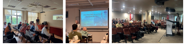
Resim 8) Diğer tanıtım etkinliklerimizden bazı kareler