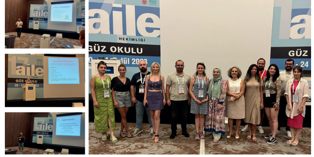
Resim 6) 17. Aile Hekimliği Güz Okulu

düzenlenecek olan 18. Aile Hekimliği Güz Okulu EYFDM Oturumunda yine genç meslektaşlarımızla bir araya gelmeyi ve deneyimlerimizi paylaşmayı sabırsızlıkla bekliyoruz.