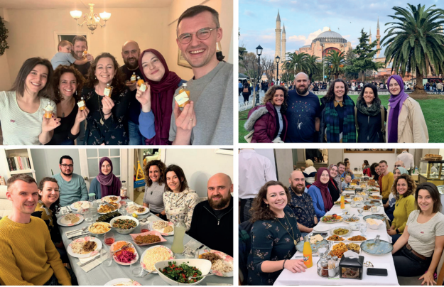
Resim 12) EYFDM Yönetim Kurulu Kampı, İstanbul