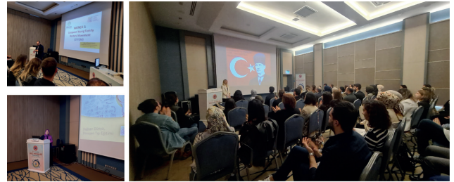
Resim 7) 22. Ulusal Aile Hekimliği Kongresi

Yoğun katılımıyla gerçekleşen EYFDM oturumunda meslektaşlarımızla, uygulamalı ve yenilikçi bakış açısıyla interaktif bir oturum gerçekleştirdik.