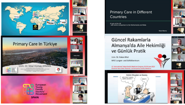
Resim 4) 12. Uluslararası Trakya Aile Hekimliği Kongresi