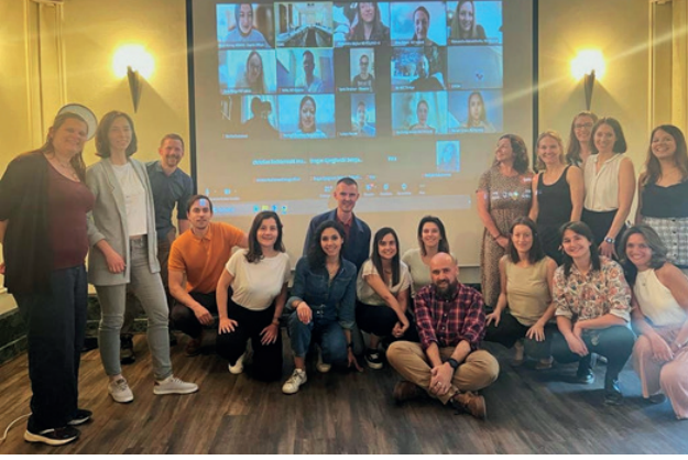
Resim 11) EYFDM Avrupa Konsey Toplantısı, Brüksel, Belçika (Hibrid)

28. WONCA Avrupa Konferansı Brüksel, Belçika'da yapılmış, meslektaşlarımızın da katılımıyla etkili bir toplantı olmuştur. 29. WONCA Avrupa Konferansı Eylül 2024'de Dublin, İrlanda'da yapılacak olup yeni başkan ve politika sorumlusu seçimleri yapılacaktır.