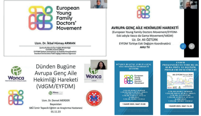
Resim 10) AHU TV – EYFDM Oturumu

http://www.ahutv.net/ sitesini ziyaret edebilirsiniz.