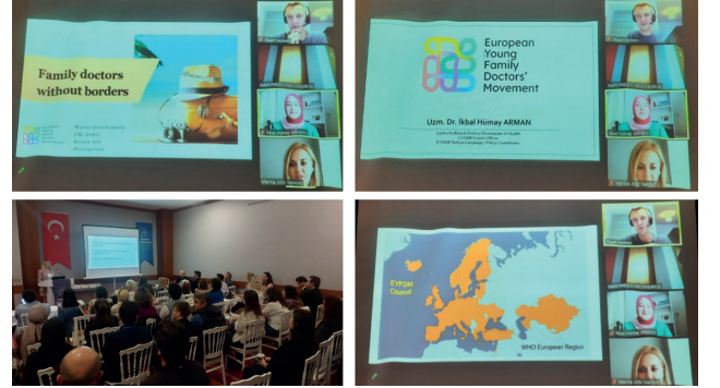
Resim 3) Uluslararası Doğu Karadeniz Aile Hekimliği Kongresi – EYFDM tanıtım oturumu