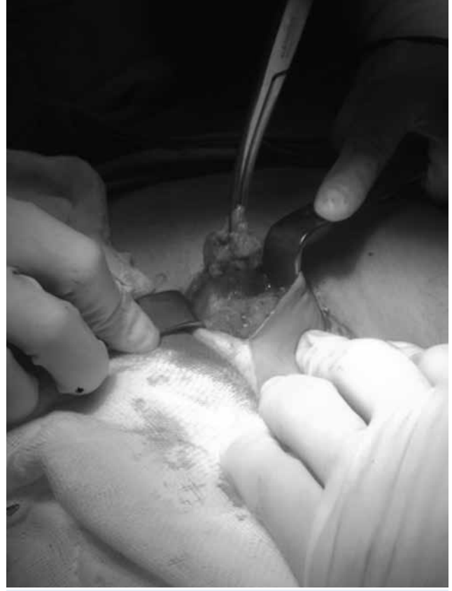
Resim-1: Kitleye, genel anestezi altında 1 cm'lik temiz cerrahi sınırla birlikte total eksizyon yapıldı ve patolojik incelemeye gönderildi.

Otuz yedi yaşında, gravida 3, para 1, abortus 2 olan hasta eski sezaryen skarının sağ üst bölgesinde yaklaşık 1 yıldır olan ve giderek büyüyen ele gelen ağrılı şişlik yakınması ile başvurdu. Hasta ağrının özellikle menstrüasyon dönemlerinde arttığını ifade ediyordu. Hastanın anamnezinden 5 yıl önce geçirdiği sezaryen ameliyatı olduğu, pelvik endometriozis öyküsü ve başka bir hastalığı olmadığı öğrenildi. Fizik muayenesinde; sezaryen insizyon skarının sağ üst kenarında, palpe edilen, cilt altı yerleşmiş, yaklaşık 3x3 cm boyutlarında, sert ağrılı kitle tespit edildi. Hastanın jinekolojik muayenesinde uterus ve overler normal idi. Diğer sistem muayeneleri normal izlendi. Batın öndüvarı yüzeysel ultrasonografik değerlendirilmesinde 29x29 mm çapında, düzensiz sınırlı, heterojen görümlü, kanlanması olan solid lezyon izlendi. Hastanın laboratuvar testleri normaldi. Olgudan pelvik manyetik rezonans görüntüleme (MRG) istendi. MRG, pelvis sağ anterior duvarında yaklaşık 1.5x2 cm boyutlarında kontrast tutulumu gösteren, transvers fasyayı içine alan, posteriorda rektus ve oblik kaslar geçiş noktasında kasların fasyası ile ilişkilenen ancak invazyon oluşturmayan lezyon izlenmiştir şeklinde rapor edildi ve histopatolojik inceleme önerildi. Kitleye, genel anestezi altında 1 cm'lik temiz cerrahi sınırla birlikte total eksizyon yapıldı ve patolojik incelemeye gönderildi