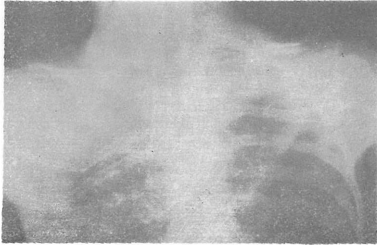
Resim 2. Skapula alata ameliyat öncesi

Öyküsü: Küçüklüğünden beri sol kürek kemiğinin çıkıntılı ve yerinde olmadığı ebeveyni tarafından ifade edilen hasta ameliyat edilmek üzere servisimize yatırıldı.