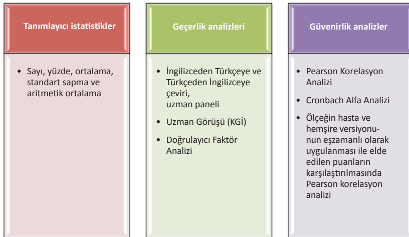
Şekil 1. Araştırma verilerinin değerlendirilmesinde kullanılan istatistiksel yöntemler

Verilerin Analizi: Araştırmada veri toplama araçları ile elde edilen veriler, "SPSS 23.0" ve "AMOS 22.0" istatistik paket programı yardımıyla aşağıda Şekil 1'de belirtilen şekilde analiz edilmiştir. Çalışmada istatistiksel anlamlılık düzeyi p < .05 olarak kabul edilmiştir.