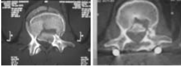
Resim 2. Redüksiyon öncesi-sonrası BT kesiti