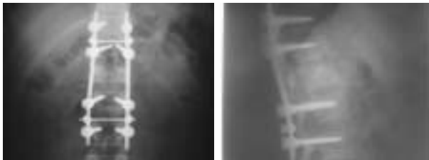
Resim 3. T12 vertebra kırığı tespiti sonrası grafiler