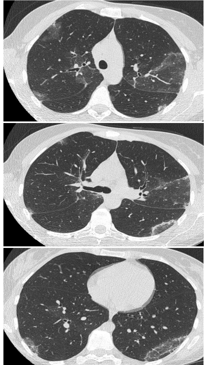
Şekil 2: Tedavi öncesi Toraks CT kesitleri.