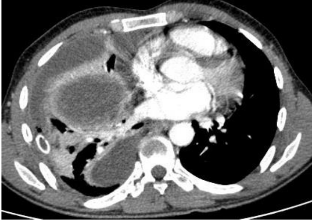
Şekil 2: Bilgisayarlı toraks tomografisi.

Plöropulmoner hastalık, erkeklerde daha sık görülmekte olup erkek/kadın oranı 9/1–15/1 arasında değişmektedir. Yaş, belirleyici bir faktör olmasa da 20–50 yaşları arasında daha sık görülmektedir. Malnütrisyon ve alkolizm genellikle hastalığa eşlik etmektedir. Plöropulmoner amebiazis, rüptüre olmamış karaciğer amip apselerinin irritasyonunun neden olduğu plevral reaksiyon, karaciğer apsесinin rüptürü ile transdiyafragmatik geçiş sonucu ampiyem, konsolidasyon, hepatobronşiyal fistül ya da daha nadir olarak karaciğer tutulumu olmaksızın metastatik akciğer hastalığı olmak üzere üç majör şekilde ortaya çıkmaktadır (6). Yaklaşık 1/1000 olarak bildirilen plevrapulmoner amebiyazis insidansı, karaciğer tutulumu varlığında %15–20 oranına yükselmektedir (7). Olgumuz 40 yaşında erkek olup karaciğerde yaklaşık 8x7 cm ebatında apse ve diyafram rüptürü ile toraksa iştirakli ampiyem vasfında sıvı mevcuttu. Cerrahi uygulanan olgumuzda geçişin trans-diyafragmatik olduğu gözlemlenmiştir.