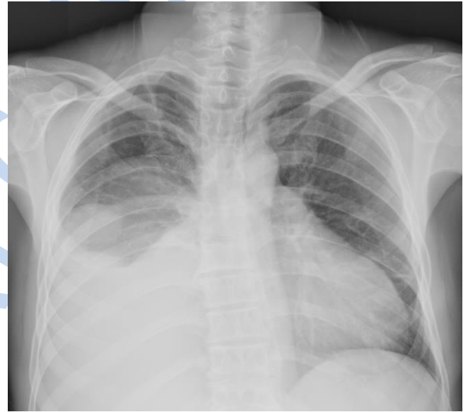
Şekil 1: Preoperatif akciğer grafisi.

lezyon (apse?) saptandı (Şekil 2). Hastanın ateşlerinin düşmemesi ve akciğer grafisinde sağ hemitoraksın açılmaması üzerine hastaya yatışın 8. gününde önce VATS (Video-yardımlı torakoskopi) yapıldı. Sağ hemitoraks diyafragm üzerinde oldukça koyu kıvamda ampiyem vasfında sıvı görüldü. Diyafragma ile ilişkili lezyon olduğu düşünülerek torakotomiye geçildi. Eksplorasyonda diyafragmanın enfeksiyondan dolayı perfore olduğu ve karaciğerden kaynaklanan apsenin toraksa drene olduğu görüldü (Şekil 3). Alt lob yüzeyinde yoğun defibrine doku mevcuttu. Bunun üzerine parsiyel plevrektomi uygulandı. Karaciğer kaynaklı apse boşaltıldı ve poş kısmına 32 F petser dren konuldu. Diyafragma primer onarıldı. Bronkoplevral fistülü yoktu. Postoperatif dönemde sağ hemitoraks 5 gün süreyle 1000 serum fizyolojik içine 10 cc betadin (povidin iyod) ilave edilerek yıkandı. Hastanın ateşi düştü ve 10. günde taburcu edildi.