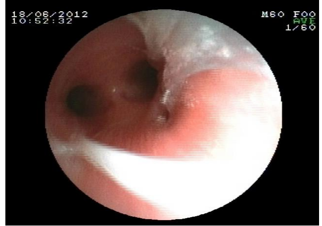
Şekil 1: Trakeal bronkusun endoskopik görüntüsü.

dığı görüldü (Şekil 2). Ayrılan bronkusun havalandırdığı alan apeksde küçük bir bölge olmasına rağmen parankim oldukça pürülan materyalle dolu ve bronşektazikti. Bronkusun havalandırdığı parankim kısmı wedge rezeksiyonla çıkarıldı.