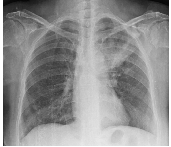
Şekil 1: PA akciğer grafisinde sol üst zonda infiltrasyon.

Poliklinikte yapılan fizik muayenesinde ateş: 39°C, nabız: 102/dk, kan basıncı: 110/80 mmHg, solunum sayısı: 14/dk idi. Akciğer oskültasyonunda patolojik solunum sesi duyulmadı. Laboratuvar incelemelerinde eritrosit sedimentasyon hızı: 68 mm/saat, C-reaktif protein: 127 mg/L, lökosit sayısı: 10.230 / \mu L, hemoglobin: 11,1 gr/dl, trombosit: 256.000, kan üre azotu: 44 mg/dl kreatinin: 1,98 mg/dl olarak saptandı. Hastanın PA akciğer grafisinde sol akciğerde arkus aorta hizasından başlayıp apekse ve periferine doğru uzanan non-homojen infiltrasyon mevcuttu (Şekil 1).