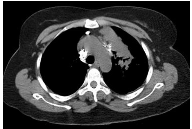
Şekil 2: Toraks BT'de sol akciğer üst lob apikal segmentte düzensiz sınırlı konsolidasyon.

Daha önceden uygulanan antibiyotik tedavisine yanıt vermemesi nedeniyle yapılan toraks BT incelemesinde sol akciğer üst lob apikal segmenti tama yakın dolduran düzensiz sınırlı konsolide alan ve çevre parankimde asiner infiltrasyonlar saptandı (Şekil 2). Mediastende büyüğü 1,5 cm çapta bazısı kalsifiye çok sayıda lenf nodu mevcuttu. Hastanın iki kez yapılan balgam ARB incelemesi menfi (negatif) olarak raporlandı. Tanısal amaçlı yapılan videobronkoskopi incelemesinde sol ana bronştan başlayarak üst lob bronşunda devam eden 0,5-1 cm çaplarında üzeri nekrotik nodüler tarzda beyaz renkli plaklar izlendi (Şekil 3).