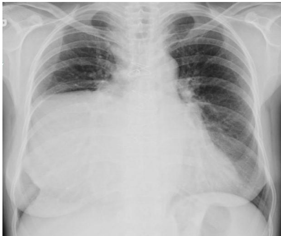
Şekil 1: Sağ orta alt zonda minor fissürle sınırlı homojen opasite.

Elli beş yaşında kadın hasta, nefes darlığı ve öksürük şikâyeti nedeni ile değerlendirildi. Özgeçmişinde iskemik kalp hastalığı nedeni ile üç yıl önce koroner bypass operasyonu mevcuttu. Solunum sistemi muayenesinde ekspiryumda uzama ve sağda solunum seslerinde azalma saptandı. Dolaşım sistemi muayenesinde ekspiryumda uzama ve sağda solunum seslerinde azalma saptandı. Dolaşım sistemi muayenesinde kalp ritmi aritmik idi. Elektrografisinde atriyal fibrilasyon mevcuttu. Diğer sistem muayeneleri normal olarak saptandı.