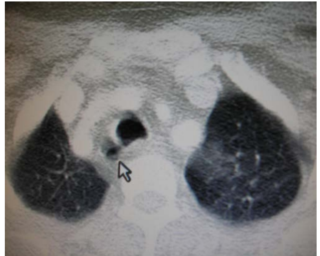
Şekil 2: Toraks BT parankim kesiti

kül konjenital veya kazanılmış olabilir. Diğer konjenital anomalilerle birlikte gözlemlenebilir (5,6). Kazanılmış formu başarısız entübasyonlar, trakea içi basıncını arttıran kronik öksürük, kronik obstrüktif akciğer hastalığı gibi durumlarda ve trakea kas zayıflığı ile birlikte olduğunda izlenebilir (1,2). Hastamızın BT'sinde de sağ paratrakeal alanda, trakea hava sütunu ile bağlantılı hava dansitesi izlendi. Hastamızda diğer konjenital anomalilerin olmaması, ileri yaş grubunda olması ve bir yıl önce genel anestezi altında geçirilmiş operasyon öyküsü olması nedeniyle kazanılmış trakeal divertikül olabileceği düşünüldü.