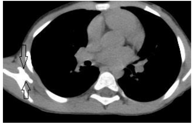
Şekil 3: Toraks BT mediasten penceresi.

Osteokondroma genellikle spesifik belirti vermez (6). Bazen ilerleyici iskelet deformitelerine neden olabilirler (7). En sık görülen deformiteler ekstremite kısalığı, ekstremite eşitsizlikleri, diz ve ayak bileğinin valgus deformitesi, pektoral ve pelvik kuşakta asimetri, el bileğinde radiusun eğimine bağlı ulnar deviasyon ve radiokapitaler eklemden subluksasyondur (3). Olgumuzda sağ skapula sola göre anormal bir şekilde farklı olup adeta kanat gibi bir görüntü mevcuttu. Ayrıca fiziksel aktivite dışında ağrı yakınması yoktu.