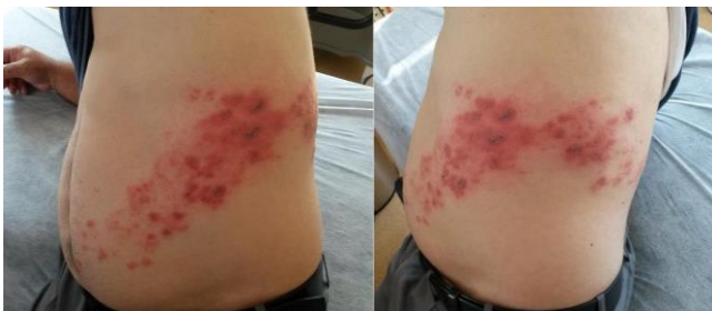
Şekil 2: Hastanın göğüs duvarında dermatom hattı boyunca seyreden, yer yer krutlu ve veziküler lezyonlar.