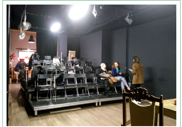
Şekil 1. İstanbulipro Tiyatro, Pasaj İçinde Dönüştürülen Eski Kiraathane Kaynak: Yazar tarafından bu makale için görüntülenmiştir, 29 Eylül 2017.

Bunların yanı sıra D22 adlı tiyatro mekânı gibi sıra dışı formların da ortaya çıkması söz konusudur. D22 oyuncular, Kadıköy'de, Hasanpaşa'daki eski bir ahşap köşkün odalarını interaktif oyun düzeninde kullanarak, sahne ve seyircinin bir arada olduğu ortamlar tasarlamışlardır (Şekil 2)