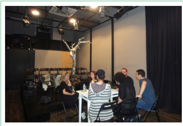
Şekil 3. Karmadrama Sahnesi ile Işık ve Ses Odasının Görünümü

Tiyatro kurucusu, yönetmen ve oyuncularla yapılan mülakatlardaki ifadeler, mekân üretim süreçleri ile ilgili edinilen deneyimler açısından oldukça öğreticidir: