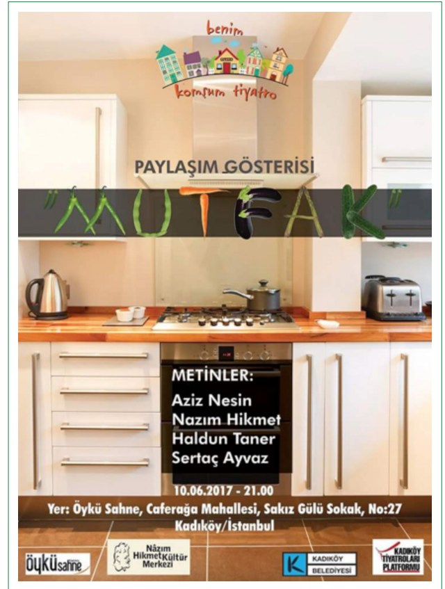
Şekil 8. ‘Benim Komşum Tiyatro’ projesi ardından komşularla sürecin değerlendirilmesi

Bu yeni nesil mekân üretimlerinin, belediyenin de destekleri ve teşvikleri ile varlık bulabilmesi, kentsel tarihi dokudaki