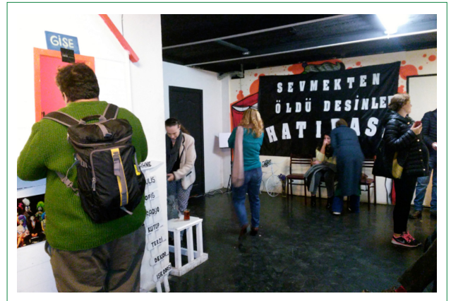
Şekil 4. Emek Sahnesi Sanatçıların Kendi Emekleriyle Yapılandırdıkları Fuaye

Oyuncuların bu mekânsal anlamdaki üretkenlikleri, kendi üretim alanları olan tiyatro sanatında yoğun bir eylem arayışında olmalarından kaynaklanmaktadır. Kendi sanat alanlarında daha çok üretim yapabilme tutkusunu, onları bu mekânsal üretim çabalarının da içine sürüklemiştir (Şekil 4) (URL-01, URL-02, URL-03, URL-09).