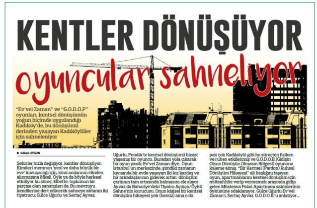
Şekil 6. Kentsel dönüşümü konu alan G.O.D.O.B adlı oyunla ilgili Kadıköy gazetesinde yer verilen haber

Kadıköy Tiyatrolar platformunun son iki sene içinde belediyenin de desteği ile gerçekleştirdiği projelerde özellikle mahalli ölçeğin ön plana çıktığı gözlemlenmektedir. Mahalle olgusunun öne çıkıyor olmasının, bu yeni nesil mekânların içinde yapılandıkları kamusalılık barındıran fiziki ortam koşullarıyla ilişkisi vardır. Çağdaş kapitalist sistemin mekânsal örgütlenmesi,