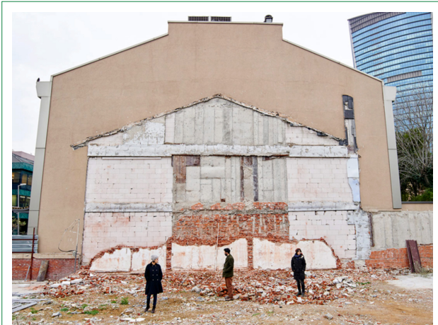
Şekil 5. Kentsel dönüşümü ele alan "Ev'vel Zaman" adlı oyunun afiş fotoğrafı

Alternatif sahneler ortamında, mekânsal, sanatsal ve sivil toplum oluşumu bağlamındaki üretimlerle ortaya çıkan tüm bu deneyimler, toplumsal kültürel belleği de güçlendiren önemli kazanımlardır. Kamusal alan, tarihin, olayların ve gerçekliğin farkında olan ve bunları tartışabilen kamusal özlemlerin varlığından beslenen bir kamusalılığı gerekli kılar. Deneyim aktarımları ile gelişen toplumsal bellek, bu ortam için temel bir gerekliliktir. Dolayısıyla sosyo-kültürel mekânlardaki üretim biçiminin, toplumsal belleğin güçlenmesine ve deneyim aktarımına imkân sağlıyor olması, bu üretimin, kamusal alana hizmet edebilecek bir kamusalılığın aracı da olduğuna işaret etmektedir.