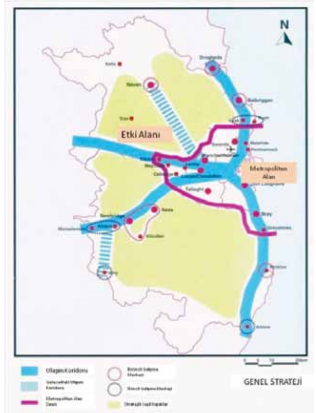
Şekil 1. Stratejik Planlama Yönetmeliği Yerleşme Stratejisi (Kaynak: Brady, Shipman Martin ve diğerleri, 1999, ix).

İlk olarak, kent bölgedeki yerel yönetimler arasında mekânsal planlama konularında mekânsal eşgüdümü sağlayacak bir stratejik siyasa çerçevesi hazırlamaya çalıştılar ve ikinci olarak bölgesel düzeyde ulaşım ve arazi kullanımının bütünleştirilmesi için bir mekanizma oluşturmaya çalıştılar. Kılavuz özel olarak tahmin edilen bir hızlı büyüme ve gelişme yirmi yıllık bir dönemini planlamayı öngörmektedir. SPG'lerin yerleşme stratejisi 'kentsel saçaklanmayı' azaltmayı ve özel ulaşım taleplerini denetim altına almayı öngörmektedir. Strateji kentsel gelişmeyi tanımlanmış bir Dublin Metropoliten alanı ve yakın çevredeki özel gelişme merkezleri içinde tutmayı önermektedir (bkz. Şekil 1). Dolayısıyla SPG'lerin hedefleri gelecekteki büyümeyi belirlenen gelime alanları içerisinde yoğunlaştırmaktır. Özellikle