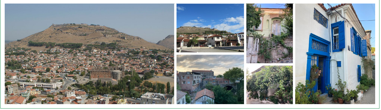
Şekil 2. Bergama kenti, Talatpaşa Mahallesi ve ödüllü yapılar.