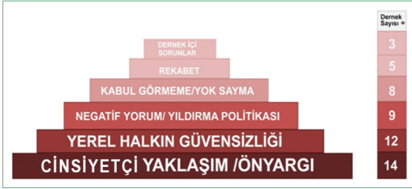
Şekil 3. Dernek kuruluş sürecinde öne çıkan kısıtlar (*: Mülakat yapılan 21 dernek içerisinde ilgili ifadeyi kullanan dernek sayısı).