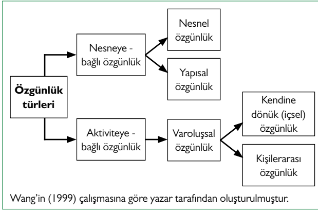
Şekil 2. Wang'e göre (1999) özgünlük sınıflandırması.

Wang'e göre (1999: 351), Boorstin ve MacCannell'in çalışmalarında olduğu gibi özgünlüğün müze-bağlantılı tanımı turist deneyimlerinde özgünlüğün karmaşık doğasını basite indirgemektedir. Özgünlüğün bu karmaşık yapısının sadece nesnel bağlamında incelenmesi yetersiz kalmaktadır. Yapısal veya sembolik özgünlüğün temeli ise konstrüktivist yönetime dayanmaktadır. Bu yönetime göre aynı şeyin çeşitli perspektiflerden farklı zamanlardan kaynaklanan ve çoklu ve çoğul anlamları vardır. Yapısal özgünlük turistler tarafından turistik nesnelere, turistlerin veya turizm girişimcilerinin imgelem, beklenti, algı, inanç ve güç gibi yönler üzerinden tasarlanmış oldukları özgünlüğü tanımlamaktadır (Wang, 1999: 352). Turistler özgünlük arayışındadır; ancak, onların arayışı nesnel özgünlük için değil, yapısal özgünlük içindir. Özünde özgün olmayan alanlar turistler tarafından özgün olarak algılanabilir, çünkü bu alanlar zaman içinde kendi kültürlerini oluşturmuştur. Yapısal özgünlüğe göre, turistik nesne farklı perspektiflerden farklı özgün anlamlar taşımaktadır ve özgünlük bu nesne için sembolik bir değer ifadesidir.