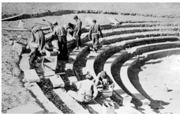
Şekil 8. Öğrenciler Hasanoğlan Yüksek Köy Enstitüsü'nün açık hava tiyatrosu inşaatında.

Köy enstitülerinin pek çoğunun yapım süreci, günümüzde sıkça gündeme gelen katılım ve katılımın ileri bir şekli olarak, kolektif üretim sürecinin gerçekleştirildiği, zamanının erken örneklerinden olması yönüyle dikkate değerdir. Aktörlerin birlikte çalışması, paylaşması, hem kuruluş hem işleyişte kolektif bir sürecin tanımlanması, problemlerin tartışıldığı ve çözüm önerilerinin geliştirildiği platformların varlığı vb. son 20-30 yıldır gündemde olan tartışma ve uygulamaların daha o dönemde köy enstitülerinde hesaba katılmış olduğu görülmektedir. Yeni kurulan enstitülerin daha önce kurulmuş olanlardan gelen yardım ekiplerince gerçekleştirilmesi, bahsedilen kolektif üretim süreçlerinin güzel bir örneğidir. Bu yolla dayanışma bilinci ve etkileşim de geliştirilmektedir. Bir enstitü yapılırken, ondan önce kurulmuş olan enstitülerde okuyan öğrencilerin yanısıra, köylüler de sürece dahil olurlardı. Enstitülerde görev yapacak öğretmenleri yetiştiren Hasanoğlan Yüksek Köy Enstitüsü'nün kampüsü, köy enstitülerinde