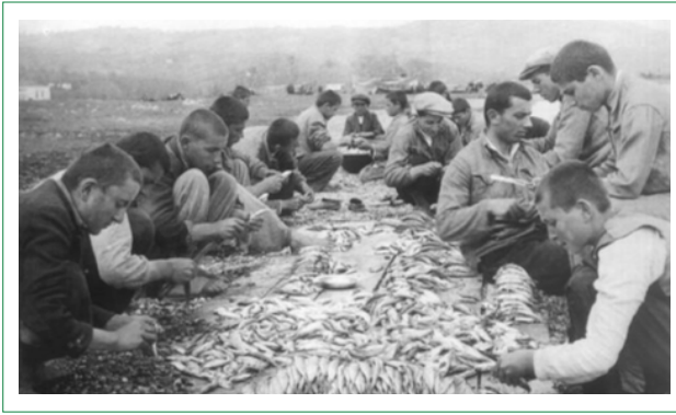
Şekil 11. Beşikdüzü Köy Enstitüsünde balıkların kurutulmak için hazırlanması.

Köy Enstitüsü ve Beşikdüzü Köy Enstitüsü'nde gelişmiştir. Ari-fiye Köy Enstitüsünde, Sapanca Gölü'nde ve İzmit Körfezi'nde balıkçılık yapılmış, balık konserveçiliği/salamura/tuzlama alanları oluşturulmuştur. Her iki enstitüde de yapılan üretimlerin enstitü bütçesine büyük katkıları olmuştur. Beşikdüzü Köy Enstitüsünde, Hopa'dan Samsun'a kadar Karadeniz kıyı şeridinde gerçekleştirilen balıkçılık, balık konserveçiliği/salamura/tuzlama/kurutma (bkz. Şekil 11) faaliyetleri, teknik anlamda deniz motoru yapımı ile de desteklenmiş, buna özel atölyeler oluşturulmuştur (Kaya, 2015).