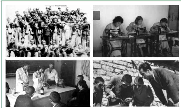
Şekil 5. Köy Enstitüsü öğrencileri müzik, dikiş, fen ve kaynakçılık derslerinde.

Bu anlamda; enstitülerde yalnız temel dersler değil, yaşama dair bütün konular bir bütünlük içinde işlenmiştir: Öğrenciler, güçlü bir tarih eğitimi, tarım, el işi ve zanaat dersleri vasıtasıyla yurttaşlık bilinci ve ulusal bilinç kazanmış; bunun yanı sıra dünya klasiklerini okuyarak, müzik dinleyerek, tiyatro yaparak, konser vererek vb. dünya değerleri ile tanışmışlardır (Ortaş, 2005, s. 3). Enstitü öğrencilerinin tarım uygulamaları,