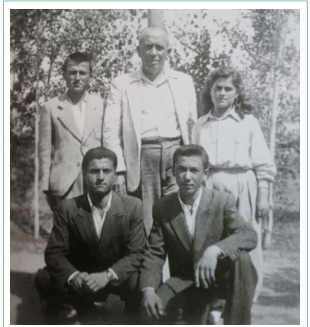
Şekil 1. İsmail Hakkı Tonguç, Hasanoğlan Yüksek Köy Enstitüsüne yaptığı ziyaretlerden birinde öğrencilerle birlikte.

1930’lu yıllarda, devlet eliyle başlatılan “plânli endüstrileşme” hareketine koşut biçimde “köyü planlı olarak kalkındır-