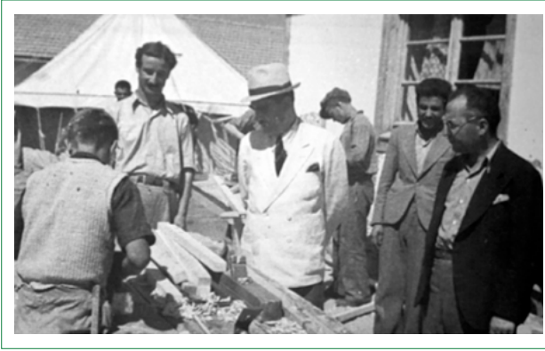
Şekil 2. Hasan Ali Yücel, Hasanoğlan Yüksek Köy Enstitüsünde çalışmaları denetlerken. Kaynak: Güneri, 2017, s.48.

ma” hareketini başlatma kararı alınmıştır. Dönemin Milli Eğitim Bakanı Saffet Arıkan, eğitimcilere danışarak İsmail Hakkı Tonguç’u İlköğretim Genel Müdürlüğü görevine getirmiştir. Tonguç, ciddi bir köy incelemesi yapmış, diğer ülkelerin eğitim kurumlarını araştırmış, ülkemize ait rakamları ve o güne dek yapılanları değerlendirmiş ve 20 yıllık bir plan taslağı hazırlamıştır. Bu plana göre 1954 yılına gelindiğinde, öğretmen, koruyucu sağlık hizmeti ve tarım teknisyeni ulaşmamış köy kalmayacaktır (Türkoğlu, 1997’den aktaran Aysal, 2005, s.271). Dönemin Milli Eğitim Bakanlığı tarafından, enstitülerin her yıl kaç mezun vermesi gerektiği hesaplanmış ve yetiştirilecek öğrenci sayıları öngörülmüştür. Örneğin; bakanlık tarafından, Milli Eğitim Bakanlığı Tebliğler Dergisi Kasım 1945 sayısında yayınlanan tabloda; 1946-1956 arasındaki on yıl içinde köy enstitülerine alınarak yetiştirilecek öğretmenlerin sayıları ve eğitmenlerin sayıları her bir enstitü için ayrı ayrı hesaplanmıştır (Bkz. Şekil 3). On yıllık süre zarfında 1956 yılı itibarıyla ulaşılması hedeflenen toplam öğretmen sayısı