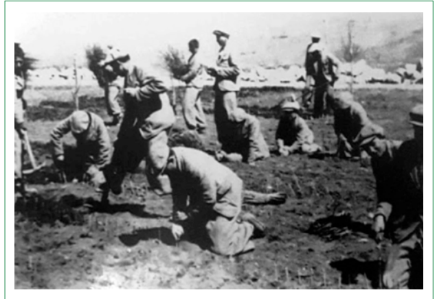
Şekil 6. Hasanoğlan Yüksek Köy Enstitüsü öğrencileri tarım uygulamasında. Kaynak: Köy Enstitüleri ve Çağdaş Eğitim Vakfı, 2016’dan aktaran Gençkaya, 2008, s.184.

Bölge esasına göre kurulmuş olan köy enstitülerinin öğrencileri, bölgede yer alan illerin köylerinde görev yapan öğretmenlerin yetiştirdiği öğrenciler arasından seçilmiştir. Karma öğretim sisteminin benimsendiği beş yıllık enstitülere, beş yıllık köy okullarını bitirip ardından iki yıllık hazırlık sınıfını tamamlayanlar kabul edilmiştir. Enstitülerin ilk üç yılı itibariyle en başarılı olan öğrenciler öğretmen olmuş, geri kalanlar da öğretmen-