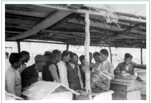
Şekil 7. Kepritepe Köy Enstitüsü’nde arıcılık eğitimi verilirken.