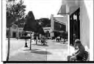
Açık alanda oturularak doğal gözetimin sağlanması

1- Doğal gözetime ilişkin maddeler halinde tasarım ilkeleri