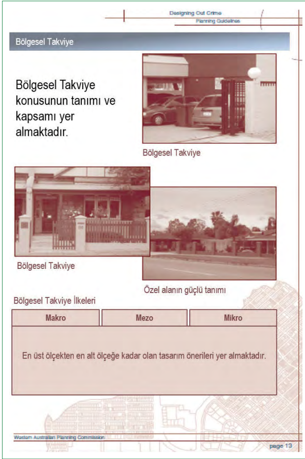
Şekil 2. Batı Avustralya Suç Önleme Rehberi'nden ilkelere ilişkin teknikler (Western Australian Planning Commission, 2006).

ilişkin dört temel CPTED ilkesini tek tek açıklanmakta ve ardından bir kontrol listesi paylaşmaktadır (Şekil 4). Devamında farklı işlev alanları için (konut ve konut alanı türleri, mahalle, kent merkezleri, ticaret sokağı, otopark alanları, eğitim alanları, alışveriş merkezleri, ofis yapıları, sanayi alanları), dört stratejiye ilişkin ilkeler maddeler halinde sıralanmakta, her işlev alanı ile ilgili tek bir örnek alan fotoğrafı ile işlev başlıkları desteklenmektedir. Ardından peyzaj düzenleri ve aydınlatma ile ilgili temel ilkelere yer verilmektedir. Rehberin daha çok uygulayıcılar ve tasarım profesyonellerine yönelik hazırlanmış olması nedeniyle rehberde ele alınan ipuçları plancılar, mimarlar gibi meslek insanlarına hitap etmektedir. Bu nedenle ayrıntısız, temel öneriler her bir işlev alanı için aynı sistematik düzende maddeleştirilerek anlatılmıştır. Sadece ancak profesyoneller için anlaşılması kolay bir teknikle hazırlanan rehberin yerleşme sakinlerini/kullanıcıyı uygulama sürecine dahil etmediği görülmektedir.