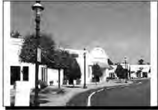
Temiz, bakımlı ve iyi aydınlatılmış alanlar müşterileri ve çalışanlarını kaygılı hissetmelerinin önüne geçmektedir

2- Doğal erişim kontrolüne ilişkin maddeler halinde tasarım ilkeleri