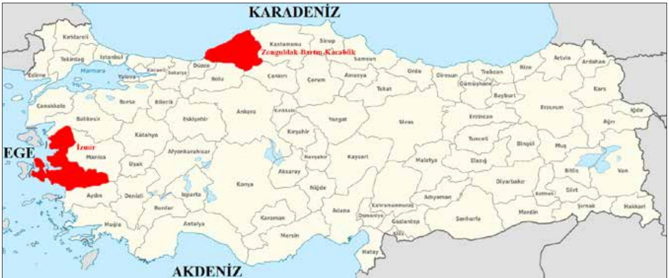
Şekil 2. Çalışma alanlarının coğrafi konumu.

BAKKA ise vizyonunu “kalkınma sürecinde yerel dinamiklere öncülük eden, yenilikçi bir ajans olmak”, misyonunu ise “işbirliği kültürünün geliştirilmesini ve potansiyellerin akılcı değerlendirilmesini koordine ederek bölgesel kalkınmayı sağ-