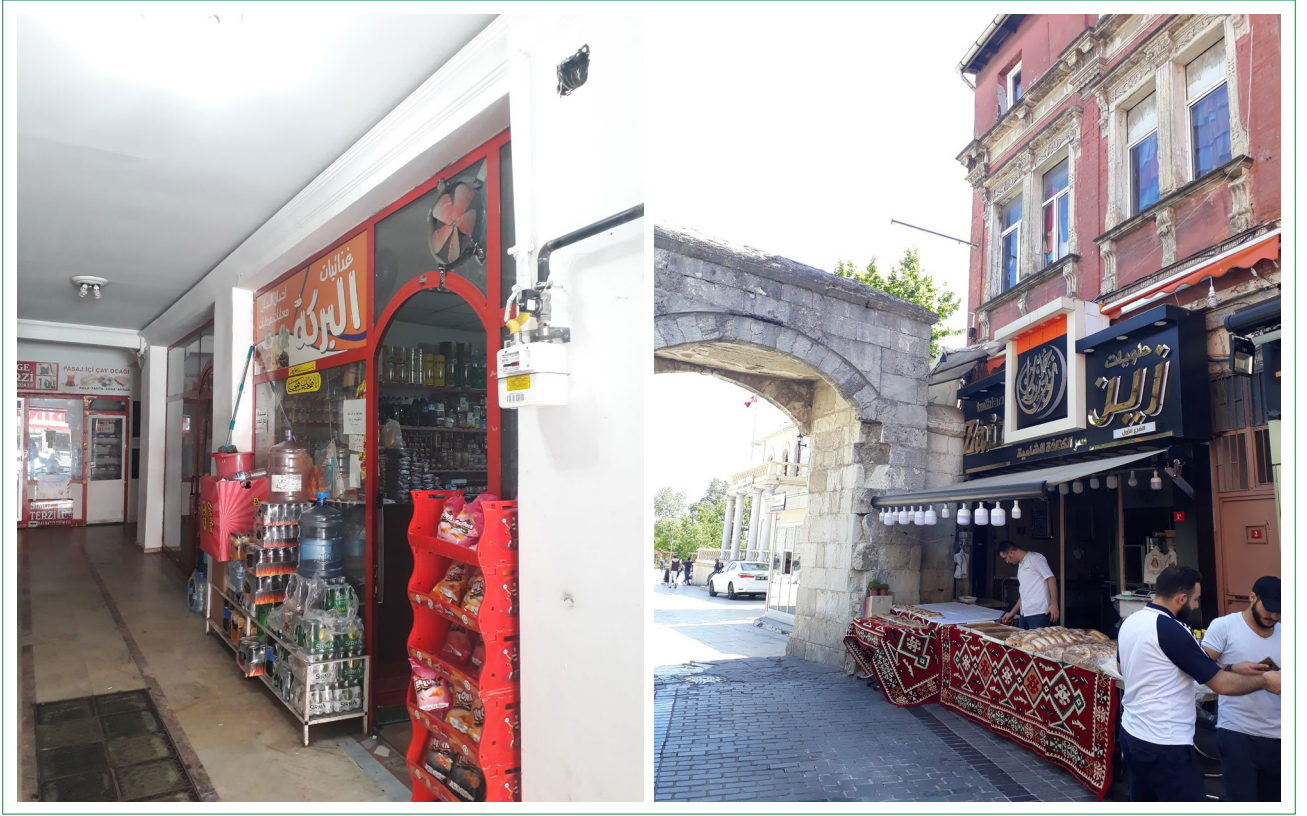
Şekil 3. İstanbul Beyoğlu ve Fatih'te işyerleri (Kaynak: Yazar).

Nitelikli işgücü grubundaki katılımcılar çoğunlukla, ilk işe erişimlerini kısa süreliğine niteliklerine uygun olmayan konfeksiyon işçiliği, perakende dükkan işçiliği, komi gibi işlerle sağlamıştır. Dil bariyerini aşana kadar kendi mesleğinde iş aramanın mümkün olmadığını belirtmişlerdir. İlk işe erişimlerinin niteliksiz grupta olduğu gibi çoğunlukla akraba, arkadaş vasıtasıyla olduğu ortaya çıkmıştır. Türkiyeli komşularının yardımıyla ilk işe girdiklerini belirten katılımcılar vardır. Sultanbeyli'de yaşayan avukat çift ilk işe girişlerini şöyle açıklamıştır: