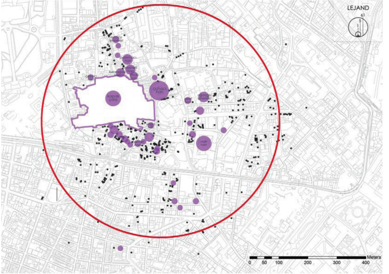
Şekil 1. Tarihî Yarımada'da İKO Üyesi Üretici İşletmelerin Mekansal Yığılması (2012).

ülke ekonomisi için önemli bir kaynak olduğu anlaşılmaktadır. Kapalıçarşı üzerine yazılan yazılar, sadece çarşı sınırları içinde altın-gümüş üretimi ve ticareti ile uğraşan 680'den fazla işletmenin bulunduğunu, bu işletmelerin toplam sermayesinin yaklaşık 30 milyon dolar olduğunu belirtmektedir (Mortan ve Küçükerman, 2010). Benzer bir hesaplama kuyumculuk dışındaki diğer sektörleri de kapsayacak şekilde yapıldığında Kapalıçarşı'nın yerel ekonomisinin toplam büyüklüğü yılda 500 milyon dolara ulaşır. Kapalıçarşı ve Hanlar Bölgesi Türkiye'deki altının %50'sini işleyen dev bir fabrika gibidir; ülkedeki en büyük 10 altın imalatçısının 9'u Kapalıçarşı'da kümeliştir. Buna ek olarak çarşı ve yakın çevresi altına yönelik sekiz tür bankacılık işlemini yapan 16 banka şubesine ev sahipliği yapmaktadır.