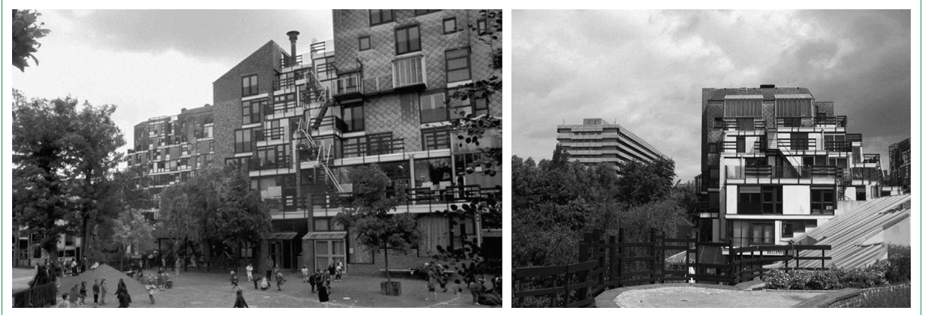
Şekil 3. Lucien Kroll'un Louvain Katolik Üniversitesi öğrencileri için tasarladığı konaklama yapısı projesi (Kaynak: Milgrom, 2008: 273–274).

çimlerine karşı gelişen insan hakları ve çevre eksensiz asimetrik toplumsal hareketlerin (ikinci dalga feminizm, eşcinsel hareketi, ırkçılık ve savaş karşıtı hareketler, çevre yanlısı eylemler, öğrenci hareketleri vb.) gündemi belirlediği, Mouffe'nin (2018) "popülist moment" olarak adlandırdığı heterojen taleplerin bir kırılma anı yarattığı görülür. (Arrighi vd., 1989: 35–36; Mouffe, 2018: 9) Böyle bir arka plana dayanan politik iklimin mimarlık ve planlama disiplinlerindeki karşılığı, çeşitlenen taleplere duyarlı, savunmacı ve katılımcı planlama ve tasarım pratikleri olmuştur. Eş zamanlı olarak mesleki rekabet ortamının profesyoneller üzerindeki baskısı, mimarları ve planlıları kim için ve nasıl çalıştıkları üzerine radikal sorgulamalara yöneltmiş ve bu durum tasarımcıların geleneksel uygulamaları reddederek insan hakları ve katılım temelli araçlar keşfetmelerine öncül olmuştur (Davidoff, 1965: 333; Comerio, 1984: 227). Katılımcı tasarımın temelini oluşturan ve döneminin görünür olmaya başlayan iklimini belirleyen bu yaklaşımlara kısaca bakıldığında, ölçekten kurumsallaşma derecelerine dek pek çok açıdan birbirlerinden farklılaştığı da görülmektedir.