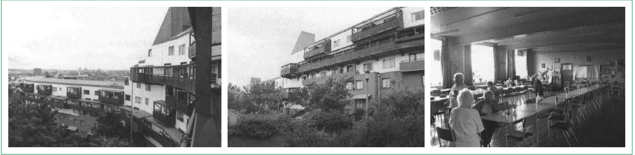
Şekil 2. Byker Wall ön görünüşü (solda), bahçe içinden görünüş ve peyzaj (ortada) ve Byker toplum merkezi (sağda) (Kaynak: Abrams, 2003: 120–122).