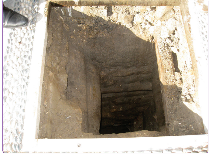
Şekil 5. Şehir içinde livas hattının görülebildiği baca (2015).