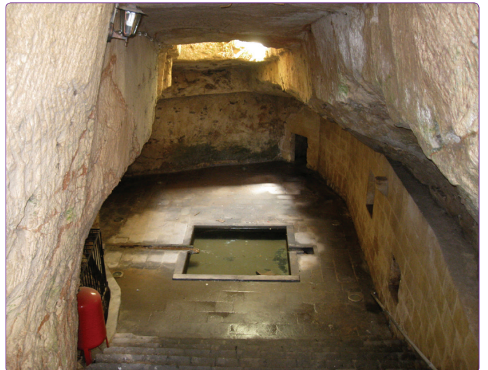
Şekil 7. Ahmet Çelebi Kasteli (2012). 56