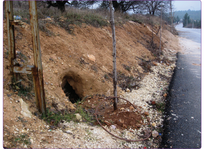
Şekil 3. Livas hattı (2014). 49

detaylı bir araştırma bulunmamakla birlikte, yer altından giden benzer su kanallarının varlığı bilinmektedir ve farklı yerlerde farklı isimlerle anılmaktadır. Örneğin Van'da kehriz 46 olarak adlandırılan yer altı su kanalları Birecik ve Suruç'ta kına 47 olarak adlandırılmaktadır.