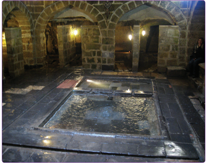
Şekil 6. Pişirici Kasteli (2010). 55