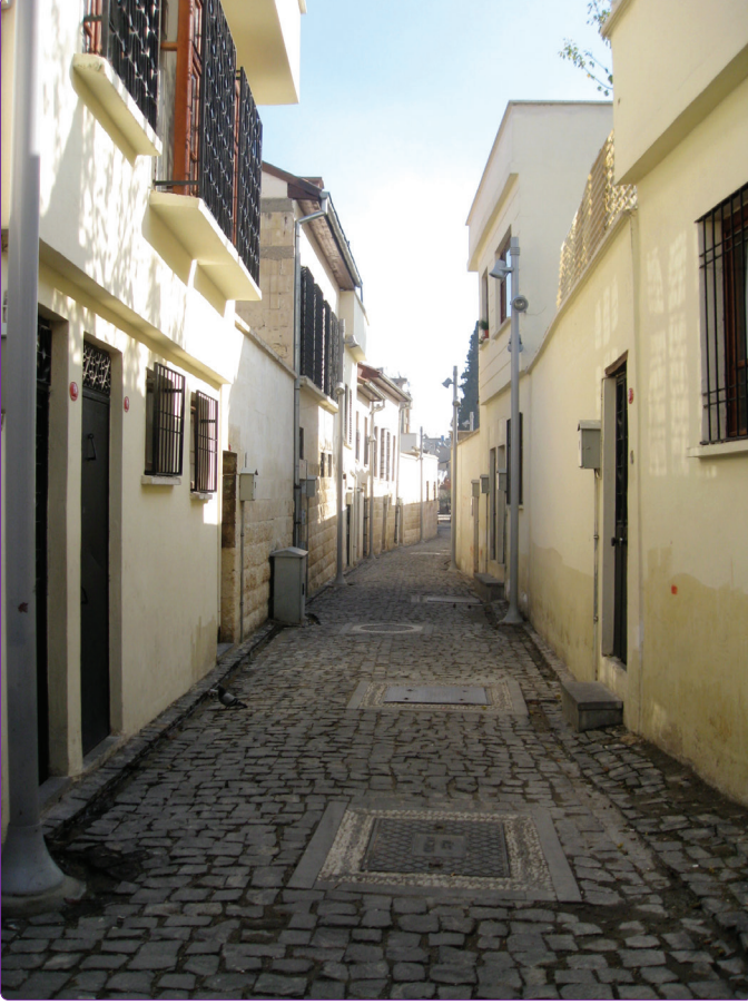
Şekil 4. Şehir içinde livas hattına ait bacalar (2014). 50

dilde livas adı verilen yeraltı su kanalları Arapçada qanât adı verilen su taşıma teknolojisi ile aynıdır.