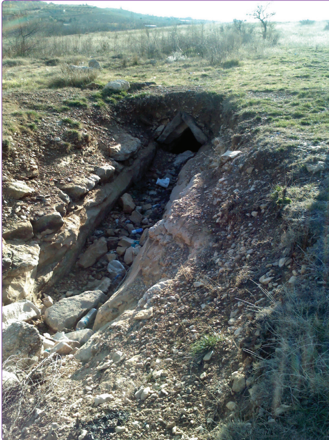
Şekil 2. Şehir dışındaki livas hattı (2015).