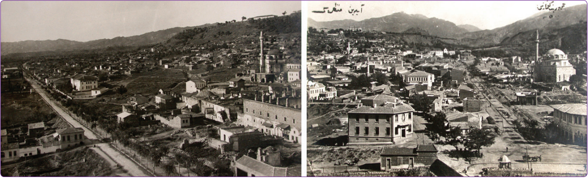
Şekil 1. Aydın'ın iki yeni caddesi; Gazi Paşa Caddesi (solda) ile ayakta kalan Osmanlı Dönemi yapılarından Nasuh Paşa Külliyesi ile batısındaki Gazi Mustafa Kemal İlkokulu ve Hükümet Caddesi (sağda) ile Ziraat Bankası (sol altta) ve Ramazan Paşa Cami (sağ üstte).

ni temsil eden Gazi Mustafa Kemal İlkokulu (1924) ve karşısına Cumhuriyet Bayramı kutlamalarının yapıldığı meydan yer almaktadır (Şekil 1). Bugün o dönemden günümüze ulaşan bazı yapılardan, Cadde'nin gösterişli yapılarla donatıldığı anlaşılmaktadır. Hükümet Caddesi ise, güneydeki İstasyon Meydanı ile kuzeydeki Hükümet Konağı'nı birbirini bağlayan diğer önemli ana aksıdır. Birinci Ulusal Mimarlık üslubundaki Belediye Binası (1926), Aydın Palas (1920'ler) gibi kentin önemli yapıları bu cadde üzerindedir. Bu bağlamda, Gazi Paşa Caddesi ve Hükümet Caddesi'nin yeni kurulan Cumhuriyet'in çağdaş ve modern yüzünün temsil edildiği önemli güzergâhlar olarak kurgulandığı söylenebilir. Kentin kamusal ve ticari merkezi, bu akslar üzerinde özellikle İstasyon ile Hükümet Konağı arasına yerleştirilirken, konutlar, bu merkezin çevresinde bulunmaktadır.