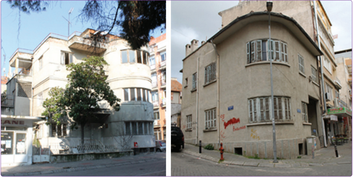
Şekil 2. Aydın'da modern yaklaşımın izlendiği günümüze ulaşan konutlar. (G. Şimşek Arşivi).

yakınına yapılan Yüzme Havuzu ve Kültür Park (1947) 19 ile bu bölge, kent için hem önemli bir konut alanına, hem de rekreatif bir alana dönüşür. Bu imar faaliyetleriyle birlikte kent savaş öncesi sınırlarına ancak 1950'de ulaşmıştır. 20