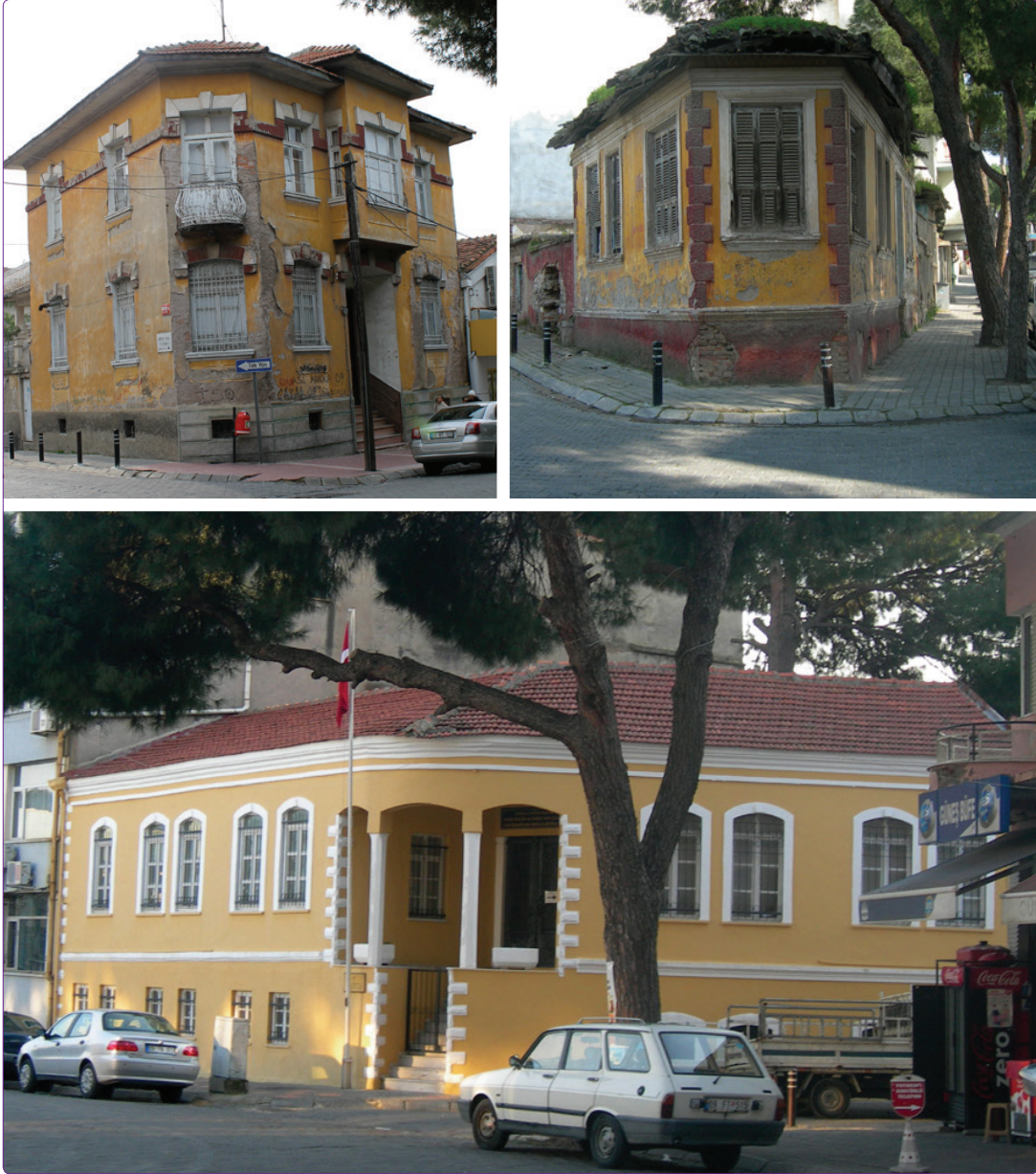
Şekil 7. Cephe köşe düzenlemesinin izlendiği konut örnekleri. (G. Şimşek Arşivi).

katlarda olabilmektedir. Örneğin, sokl+1 yapılar, sofanın zemin katta olması, zemin+1 yapılar üst katta olması söz konusudur. Odalarda, yatak odası, oturma odası gibi bir ayırma ve özelleşmeye rastlanmamaktadır. Bu genel plan özelliklerinin yanında konutlar, plan şemalarına göre başlıca beş grupta incelenmiştir: (1) yan sofalı konutlar, (2) dış sofalı konutlar, (3) 'T' sofalı konutlar, (4) orta sofalı konutlar ve (5) merkezi sofalı (Şekil 8).