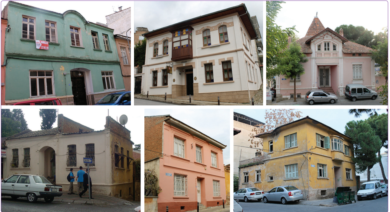
Şekil 5. Simetrik cephe düzeni sergileyen konut örnekleri.

Asimetric cephe düzenlemesinde, genellikle cephenin bir kısmına yükseltilmiş giriş ve cephenin diğer kısmına, pencereler yerleştirilmiştir. Bu konut cephelerinde genellikle aynı biçimsel özellikler gösteren pencereler bulunmakta iken, sadece birinde giriş üstüne balkonun yerleştirildiği izlenmektedir. Belirtilen asimetric cephelerin yanında, Birinci Ulusal Mimarlık Üslubu'nun izlendiği asimetric cephe düzenine sahip