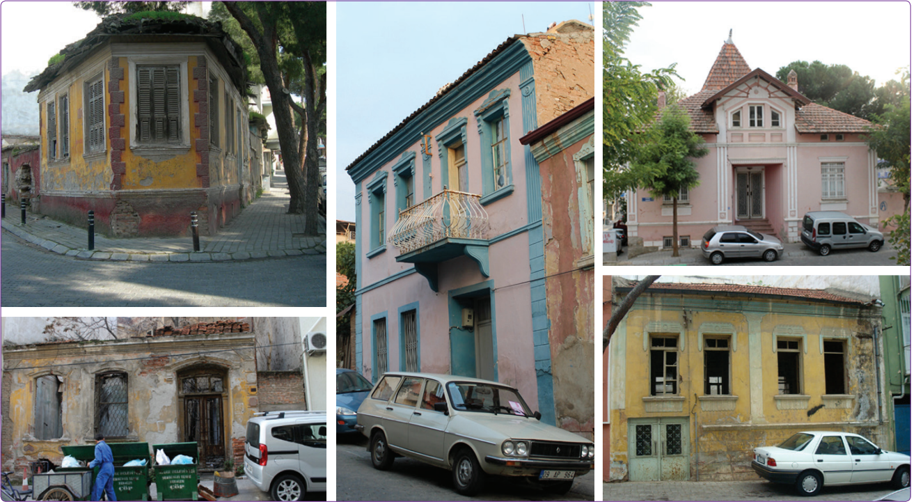
Şekil 6. Asimetrik cephe düzeni sergileyen konut örnekleri.

bir konutta cephede sivri kemerli pencere düzeni ve köşe dönen bir balkona rastlanmaktadır. Sözelimi, entin ana akslarından Hükümet Caddesi üzerinde konumlanan bir konut, cephe düzenlemesi ile oldukça gösterişli bir görünüm sergilemektedir (Şekil 6).