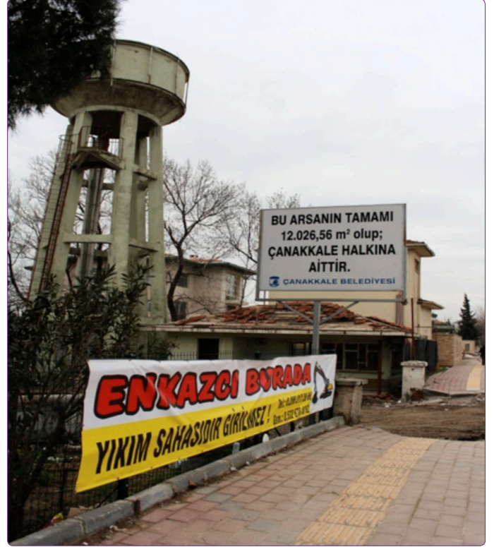
Şekil 3. Eski Tekel Şarap ve Kanyak Fabrikası Arsası.

“Sadece işletmeyi vermedikleri için mülkiyetini de devrettikleri için daha sonra işletmeler de kapılarını kapatıp belediyenin kapılarına dayanıyorlar, rant sağlamaya çalışıyorlar. Bu noktada kapımızı çaldıklarında, onlara şunu söyledim: Dediler ki ‘Biz buraya bir çarşı yapalım’, ‘Tamam’ dedim; çünkü o da bir ekonomik faaliyet, ayrıca bir ticari alan olarak düşünülebilir. Biz de onların şartlarını koyduk. Orada