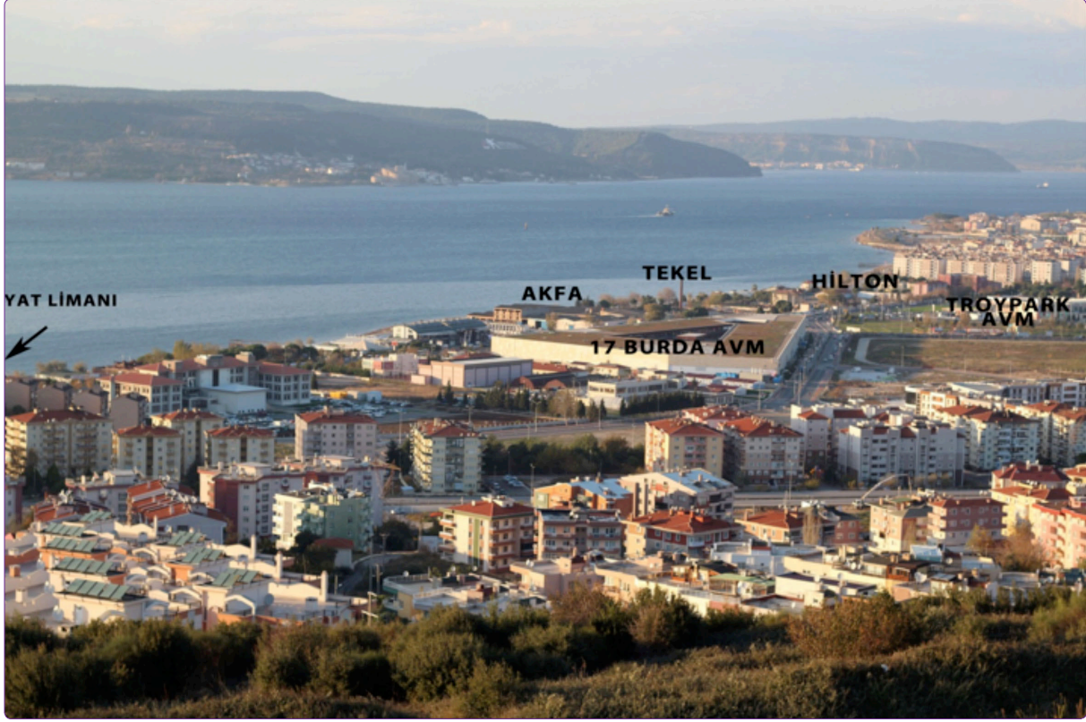
Şekil 2. Çanakkale Kıyı Şeridi ve çevresinde son dönemde planlanan ve yapılan projeler.

Fabrikası'nın bulunduğu Barbaros Mahallesi Kıyı Bandı, 3.10.2007'de onaylanan 1/5000 Revizyon Nazım İmar Planında "Özel Proje Alanı" olarak tanımlanmıştır. "Özel Proje Alanı" olarak tanımlanan bu alan için plan notlarında, "Kamusal amaçlı kullanıma açık park, yol, yeşil alan, rekreasyon alanı, kültürel tesis, sosyal tesis kafe, lokanta, alışveriş merkezi, konaklama tesis alanı, oyun alanları, spor alanlarının" yapılabileceği belirtilmiştir. 16 1/5000 Revizyon Nazım İmar Planı'nda Barbaros Mahallesi sınırları içinde kalan Özel Proje Alanı dışındaki kıyı alanları ise Konut Alanı, Turizm Tesis Alanı, Resmi Kurum Alanı kullanımlarına ayrılmıştır. Turizm Tesis Alanı kullanımı olarak belirlenen alanda ise 2015'te Çanakkale Belediye Meclisi'nden geçerek inşaatına başlanan Hilton Oteli yükselmektedir (Şekil 2). Yeni yapılaşma ve yatırımlarla birlikte Barbaros Mahallesi'nin sınırları genişlerken, yeni yatırımcıların da ilgisini çekmektedir.